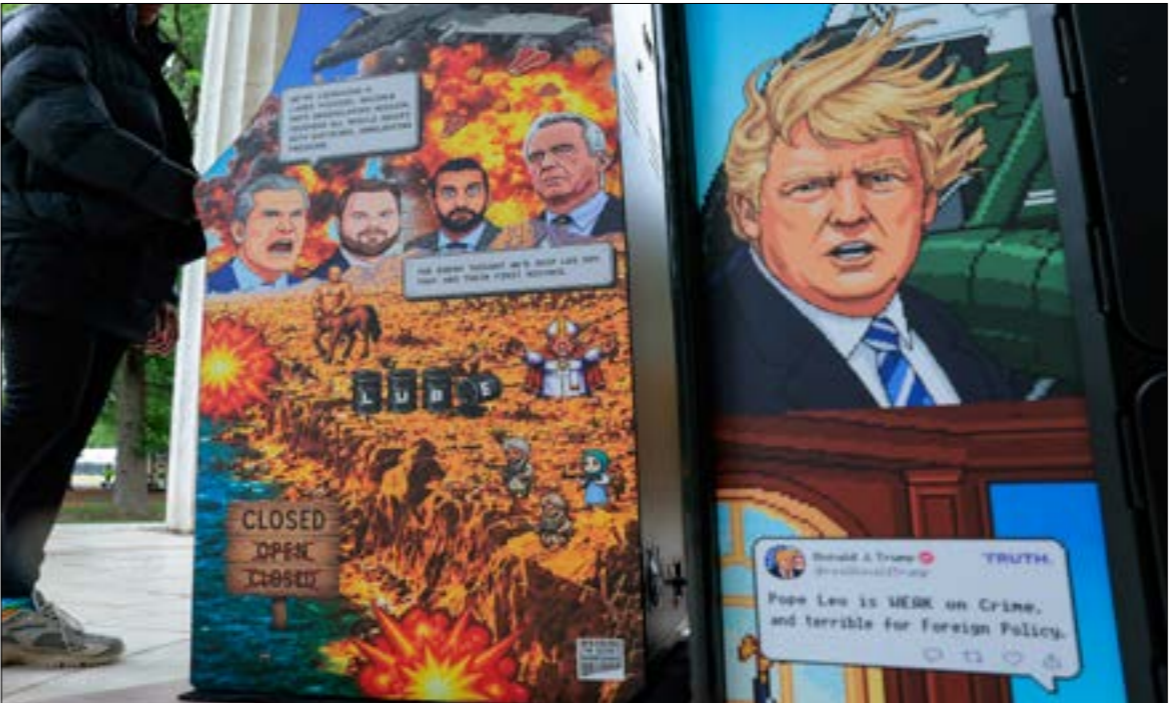
لعبة فيديو جديدة في امريكا للحدث سخريه عن عملية الغضب الملحمي، ضد ايران، بتسميتها «عملية التعذيب الغاضب الملحمي، الطرف إلى الجحيم» (فاب)

قائلاً: «تمكن أهمية هذه المبادرة في أنها تباعد عن منطق الأمن المستورد. فهي تُسدّد على احترام سيادة الدول، والالتزام بالتعايش السلمي، واحترام القانون الدولي، وربط الأمن بالتنمية وبالنسبة إلى إيران، فإن قيمة هذه المبادرة تكمن في أنها تسعى إلى تحقيق أمن غرب آسيا، ليس عبر بناء تحالفات ضدّ دولة معينة، بل عبر الحوار والاعتراف بالمصالح المشروعة لجميع الأطراف». كما تحدّث السفير الإيراني عن إمكانية قيام الصين بدور الوساطة بين إيران والولايات المتحدة، قائلاً: «يمكن للصين أن تتفكّ قدرة مهمة على المساهمة في خفض التوتر، لكن ذلك مشروط بأن تقبل