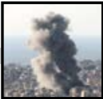
الحرب الكونية ضد المقاومة