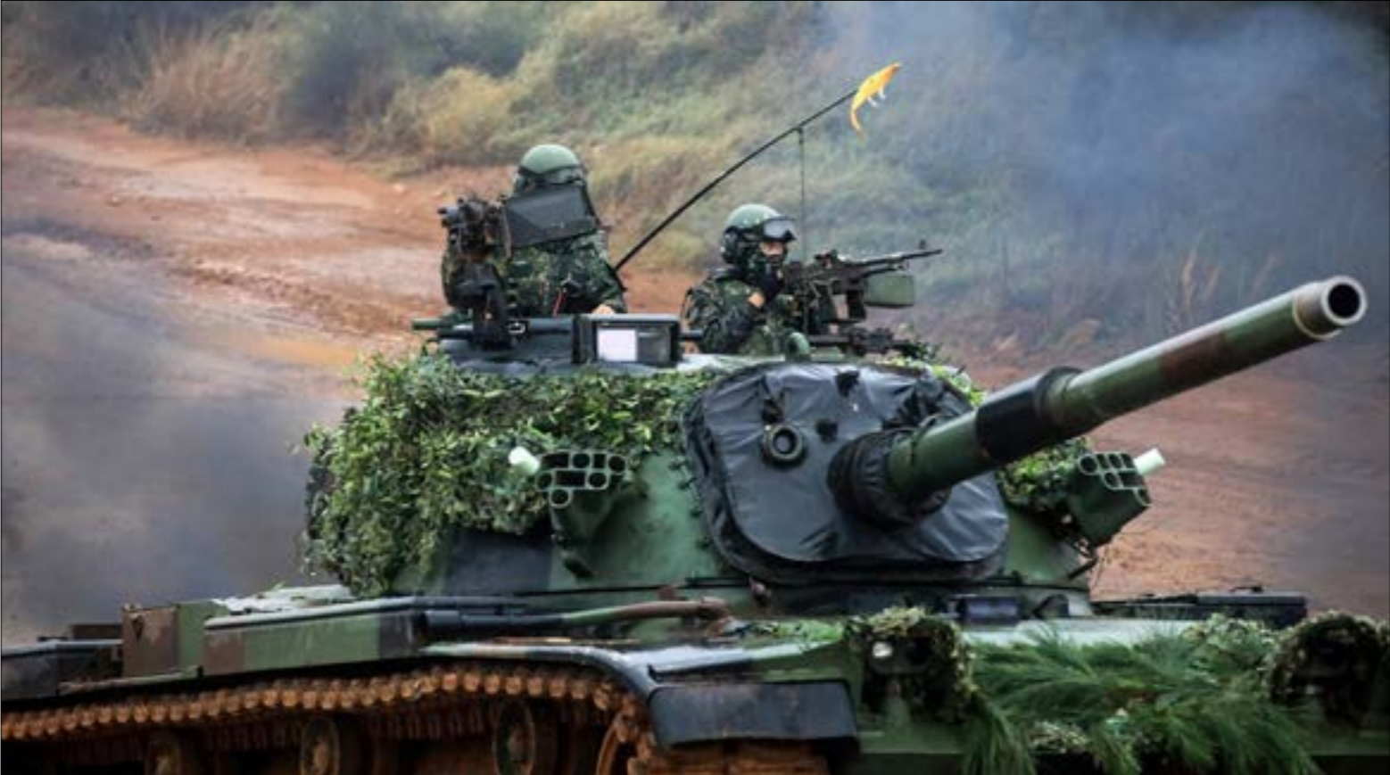
العمل الذي أنتج بملحة حكوميّة اقرب إلى جهد موجّه من النخبة الحاكمة في تايوان لتقبل عسكرة المجتمع