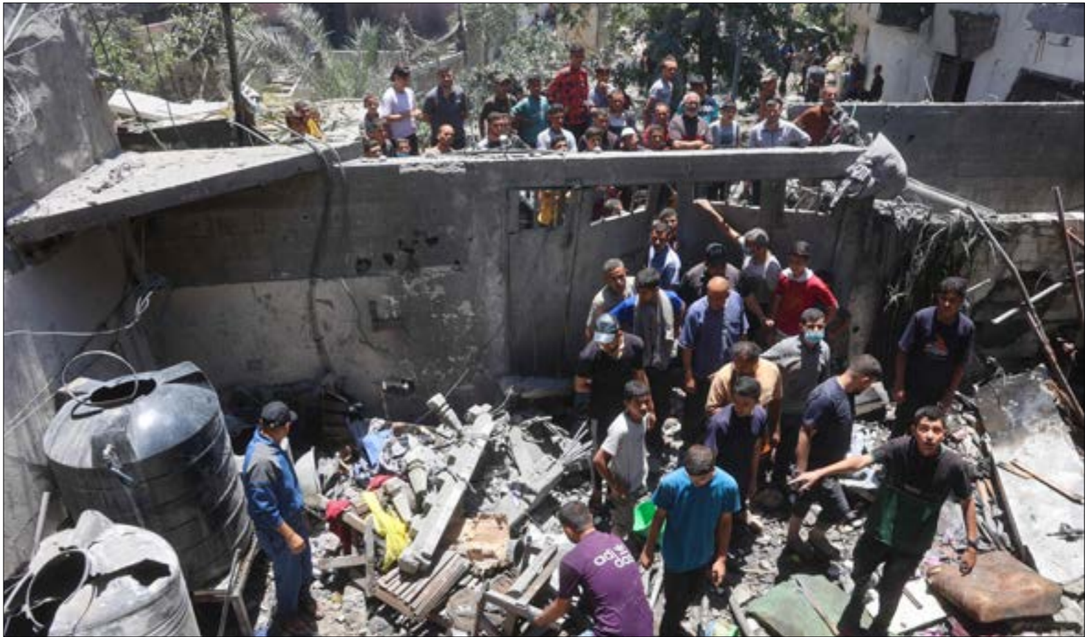
العدو يستخدم نواعما غربية من الطائرات في الغارات على غزة