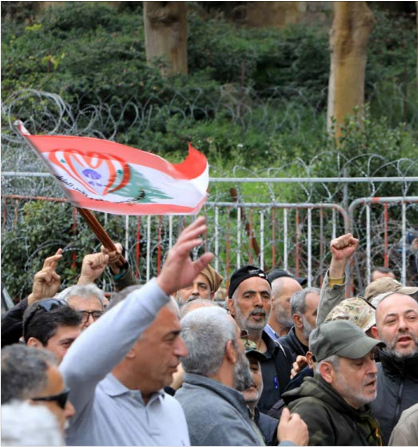
اتّسمت التبادات بالصعوبة والأعدالة (هيلم الموسوي)

هذه الفترة بمعدّل 62 ضعفاً، علماً أنّ سعر الصرف ارتفع 58 ضعفاً من 1507,5 ليرات وسطياً لكل دولار إلى 89500 ليرة وسطياً، ما يعني أنّ ارتفاع الأسعار لم يعد مرتبطاً بتقلبات سعر الصرف، وفي الواقع، فإنه منذ العودة إلى تثبيت سعر الصرف ليبلغ 89500 ليرة لكل دولار وبالتالي صارت الأسعار مدوّلة بشكل كامل. عملياً، ارتفعت الأسعار أكثر من 45%، وما