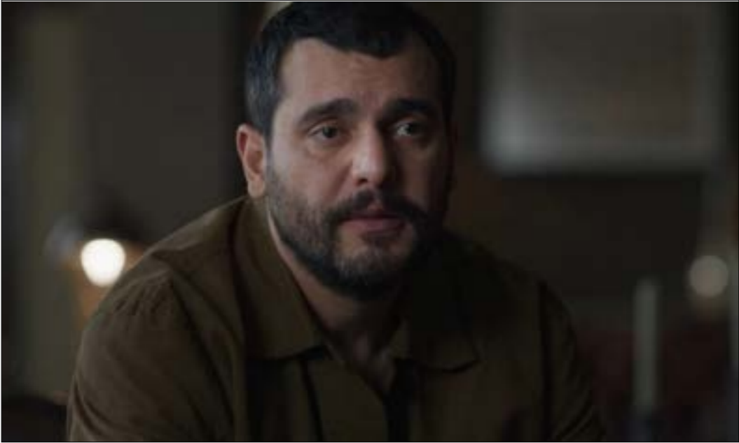
دراما العنصر، هل استطاعت فعلاً أن تخلف نوما درامياً جديداً؟

أهم ما يلفت النظر في هذا المسلسل هو طبيعة الدراما الجديدة، ومستوى جودتها، ومعايير صناعتها في ظل تغزير البيات الإنتاج. فدخلت منصات عالمية مثل نتفليكس إلى ساحة الإنتاج العربي، أحدثت تغييرات جوهرية في معايير الصناعة ومعايير الجودة، وفرض أنماطاً مختلفة من الخلق أثرت بدورها في طبيعة الحكايات وطرق سردها. لكن يبقى السؤال مطروحاً: هل يمكن رصد تحولات مماثلة في الدراما العربية التي تُنتج خارج السياق الرمضاني، والمتحررة من البيات إنتاجه وعرضه على القنوات التقليدية؟ والأهم، هل يمكن تقييم أثر هذه التحولات في ضوء المنصات الجديدة بعيداً من «شاهد»، التي تبقى في النهاية امتداداً لمنظومة قنوات MBC، بل عبر منصات