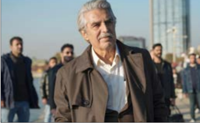
أحد اأ مطلب السوريين انتخابات حرة ونزيهة

حلقه من تصفية الحسابات». وأكد أن جنود الجيش السابقين «غير متورطين في جرائم الأسد.