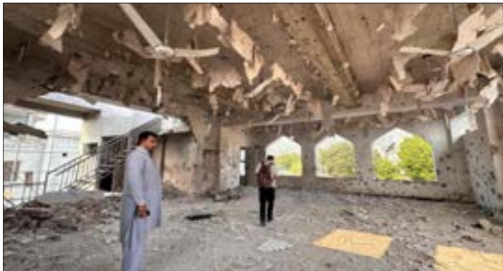
مته في مقاطعة كولتي في كشمير تضرر نتيجة غارات هنديّة

للمخارجية، تحدّث إلى نظيره الهندي والباكستاني، داعياً الطرفين إلى «تهدئة الوضع» المتأزّم بينهما عبر الحوار. وبحسب وكالة «فرانس برس»، فقد دعا الوزير الأميركي، طرقي النزاع إلى «إعادة فتح قناة للنقاش بين قادتتهما من أجل نزع فتيل الأزمة وتجنب مزيد من التصعيد». وفي تطور لافت، وبعد فترة وجيزة من إصدار السفارة الأميركية بياناً نصحت فيه رعاياها بمغادرة مناطق الصراع بين الهند وباكستان، اعتبر الرئيس الأميركي، دونالد ترامب، أنّ الضربات الهندية على أهداف في باكستان «مخزية»، وفي إطار الدعوات الدولية المتكرّرة إلى كل من إسلام اباد ونيودلهي بضرورة ضبط النفس، أعرب الناطق باسم الأمن العام لأمم المتحدة، ستيفان دوجاريك، عن قلقه للغاية إزاء العمليات العسكرية في باكستان، وفي الشطر الخاضع لإدارة إسلام اباد من كشمير، وفي السياق نفسه، تُكرّرت وكالة «رويترز» أنّ مسؤولين كباراً في حكومة إسلام اباد على إجراء محادثات مع الهند لحلّ الأزمة، على رغم تشديده على أن أي أعمال عنادية من جانبها ستقابل الجيش الباكستاني، معرباً عن انفتاح مودي تحذّثوا إلى نظرائهم في أميركا وبريطانيا والسعودية والإمارات وروسيا لإطلاعهم على الخطوات التي اتخذتها الهند بعد الهجوم الذي أدى إلى مقتل عدد من مواطنيها. كذلك، أعلن البيت الأبيض أن رويدو، الذي يشغل حالياً منصب القائم بأعمال مستشار الأمن القومي، إلى جانب كونه وزيراً