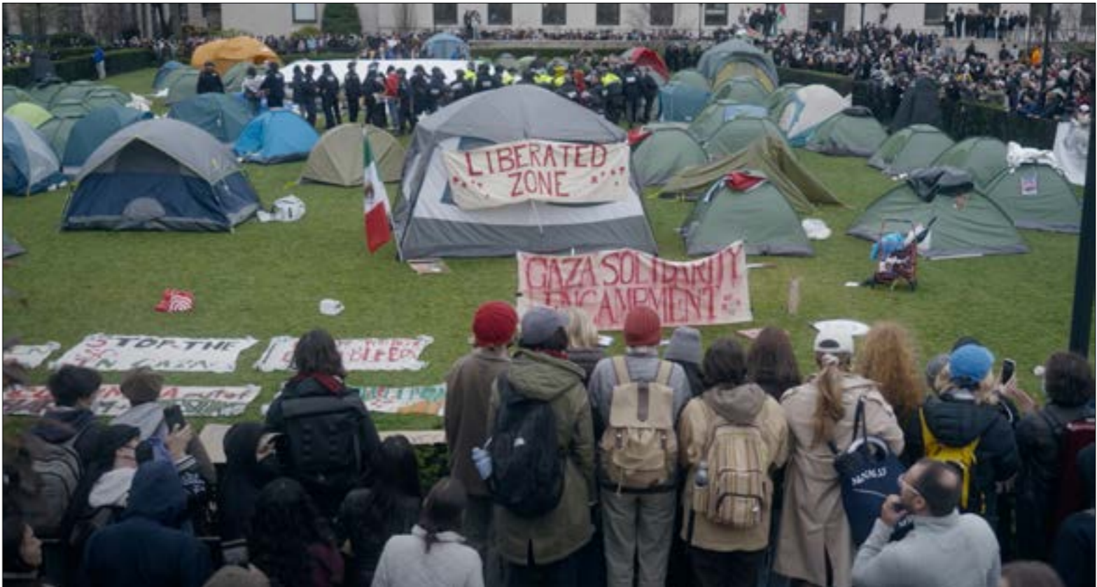
يُقدّم وثائقي «المخيمات» رؤيةً تستهفك الجمهور الكلنر عرضةً للتأثر بالرواية الغربية حول الصراع