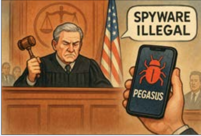
صورة منشأة عبر الذكاء الاصطناعي

في مواجهة اتهامات بانتهاك أمن منصات رقمية.