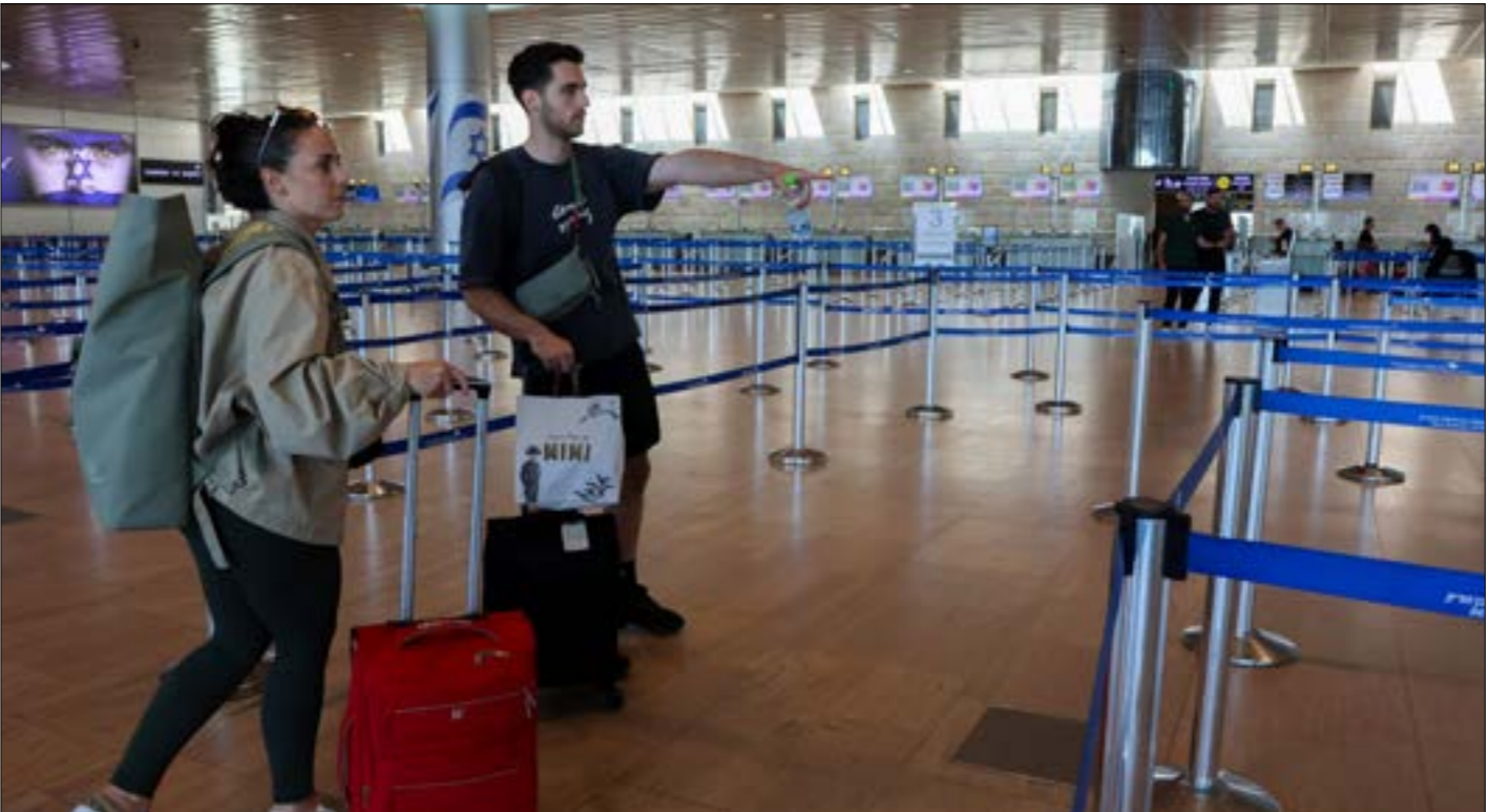
حركة متراجمة في مطار «بن غوريون»، في تل أبيب نتيجة القصف والتهددات من اليمن (أف ب)

لم تُخَطّر إسرائيل مسبقاً، بما أقدمت عليه، وإنّ «ترامب فاجأنا»، وتعلّقوا على ذلك، تشير مجلة «ذي أتلانتيك» الأمريكية إلى أنّه في حال كان أي شخص يتساءل كيف يمكن أن تبدو سياسة «أميركا أولاً»، فقد قدّم ترامب «مثالاً حياً عنها اليوم من خلال إعلانه وقف إطلاق نار مع الحوثيين»، مشيراً إلى أنّ الولايات المتحدة نجحت في «انتقال نفسها من الصراع، من دون أن تتمكّن من إنهائه»، ولا سيما أنّه من مؤشّر، حتى الآن، إلى أنّ «الحوثيين