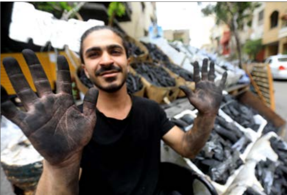
انتصر أصحاب العمل على العمال (هيلم الموسوي)