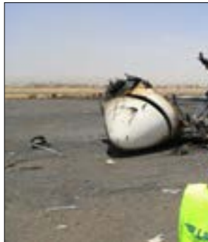
قُدرت الخسائر في مطار صنعاء نتيجة العدوان الإسرائيلي بـ 500 مليون دولار

موزانياً على العدوان الذي أدى إلى إخراج مطار صنعاء الدولي عن الخدمة، واستهدف معظم مرافقه، ودمر عدداً من الطائرات المدنية التي كانت رابضة هناك حويوياً في منطقة تل أبيب بطائرة مُسرّنة نوع «بافا»، وقال إن قواته نفّذت عمليتين جوية نوعية استهدفت حاملة الطائرات الأميركية «ماري ترومان» وعدداً من القطع الحربية التابعة لها شمال البحر الأحمر، بصاروخ بالستي وعدد من الطائرات المُسرّرة، مشيراً في مرافق طائرة أميركية «إف 18»، هي الثانية في غضون أسبوع، بسبب حالة الإرباك والدُعر التي وصل إليه العدو أثناء عملية الاستهداف التي حدثت «قبل إعلانه وقف عدوانه على بلدنا». وكان الإعلام العبري أكّد أنّ هجوماً صاروخياً منمياً استهدف إسرائيل، بعدما أعلن جيش الاحتلال في وقت سابق، امس، اعتراضه طائرة مُسرّنة قادمة من اليمن.