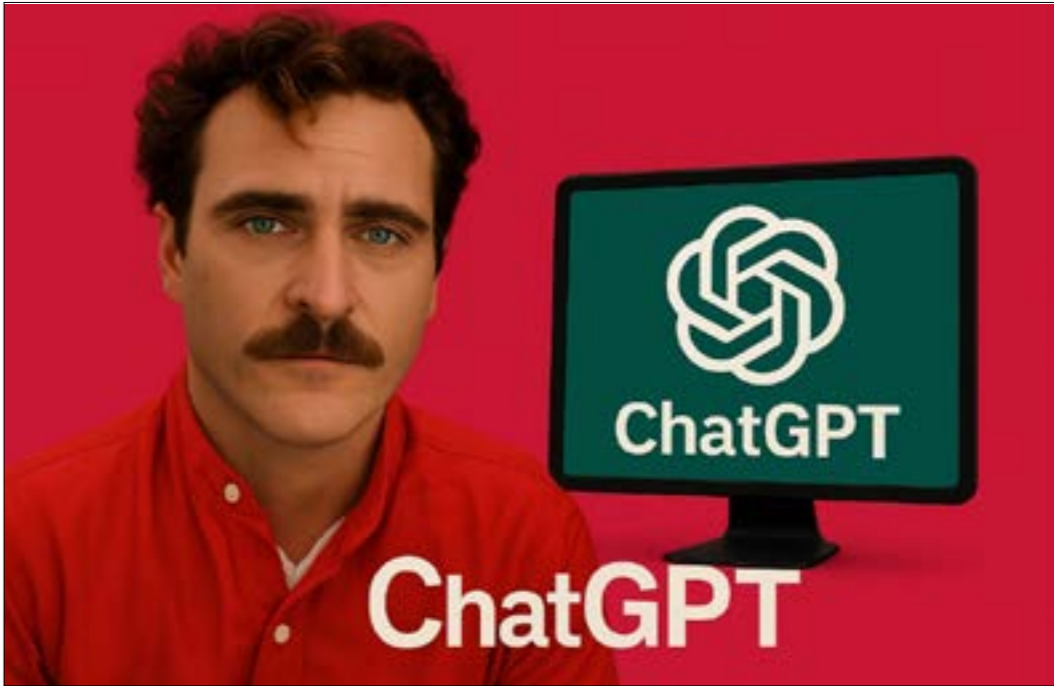
سكوت جباننا شبيمة بفيلم HER (صورة مشابهة بالذكاء الاصطناعي)

توفر الشبكات الاجتماعية مصادر ضخمة من البيانات اليومية المتجددة. تشكل هذه البيانات عصباً أساسياً في تدريب نماذج الذكاء الاصطناعي وتحسين أدائها. شركات مثل «ميتا» و«X» تعتمد بشكل مستمر على هذا النوع من