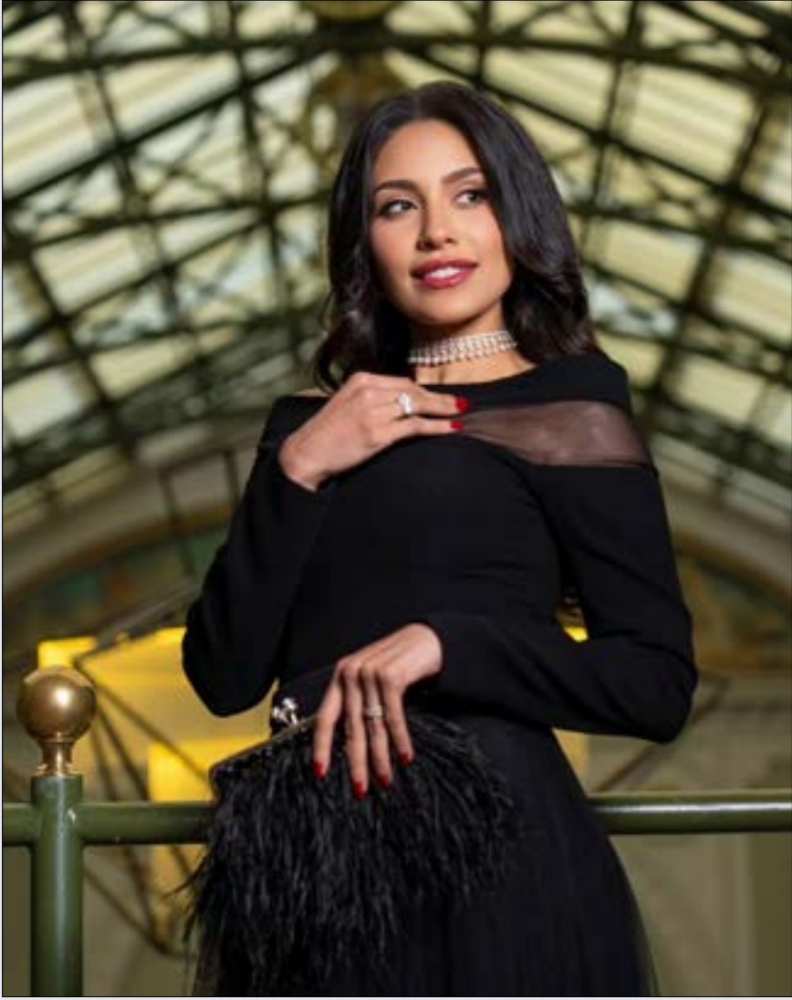
لتعاقدت «صباح إخوان» مع الممثلة السعودية إلهام علي لبطولة مسلسل