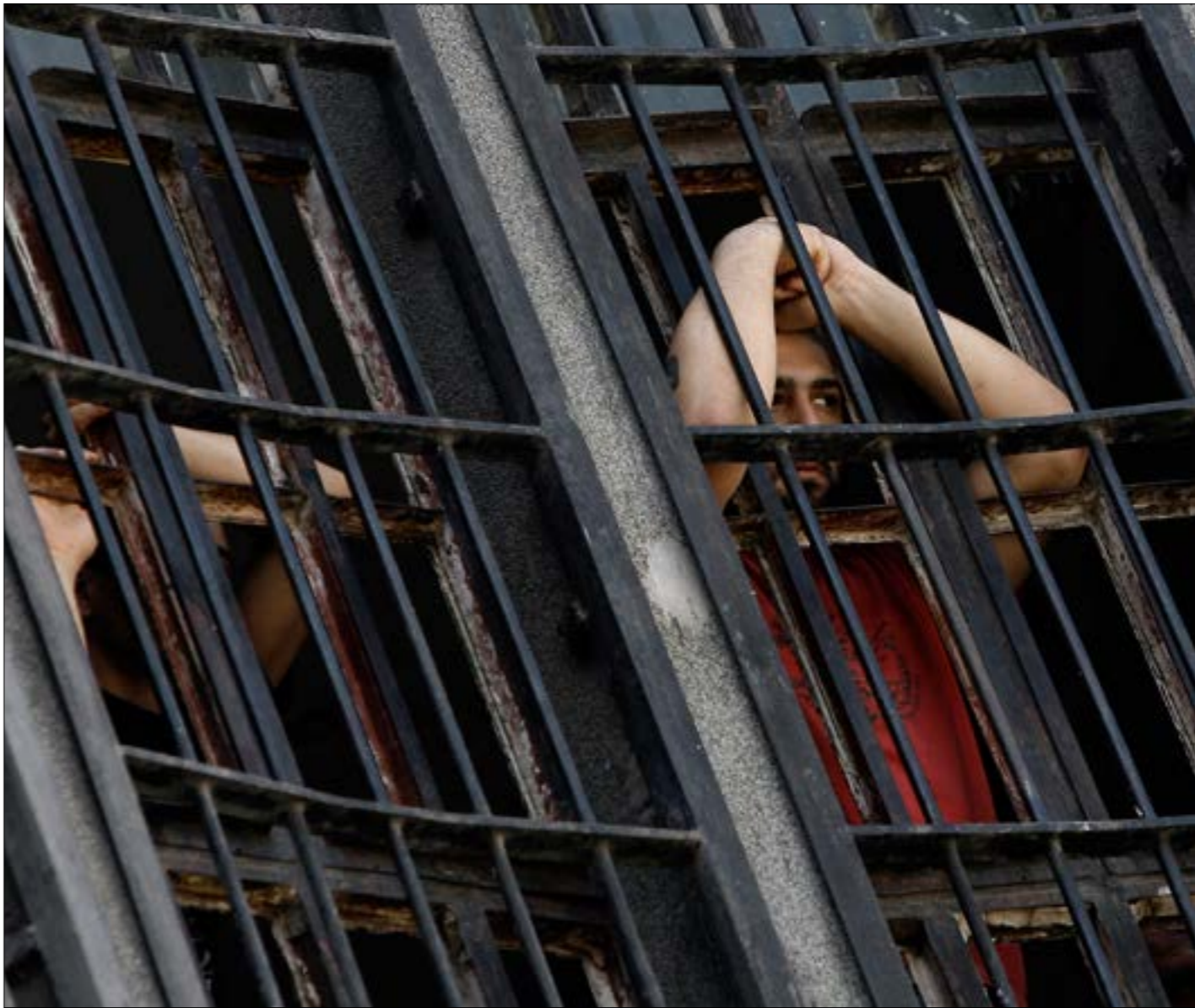
ليس خافياً انتشار المخدرات داخل السجن

الداخل لدواعي التسليبة والحصول على بدل مادي يشعر السجنين بانه منتج ولا يشكّل عبئاً على أهله. والهدف من كل ذلك تنظيم أنشطة السجناء اليومية بعد الفوضى التي جاؤوا منها، وإشغالهم حتى لا يخططوا لافتعال جرائم أخرى، وليشعروا بالقدرة على الإنتاج خارج إطار الجريمة، كما يفيدهم والأشغال اليدوية وغيرها، إضافة إلى ضرورة خلق فرص عمل في