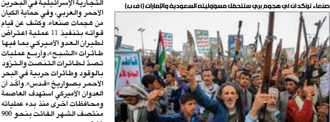
صنعا، تؤكد أن هجوم بري ستخطه مسؤوليته السعودية والإمارات

وقد سرّبت وسائل الإعلام منذ أيام أن البحرية الأميركية أقرت، خلال جلسة استماع أمام لجنة القوات المسلحة في مجلس الشيوخ هذا الشهر، بوجود ذخائر في الجداول الزمني لحامتي طائرات من فئة «فورد» قيد الإنشاء، وأبرز هذه السفن هي حاملات الطائرات «جون كينيدي» التي اكتمل بناؤها بنسبة 95%، ولكنها تواجه صعوبات شديدة للوفاء بموعده تسليمها المقرر في تموز المقبل، بسبب مشكلات في مصاعد الأسلحة المتقدّمة ومعدات إطلاق واستعادة الطائرات، فضلاً عن أن بناء حاملات الطائرات «إنتربرايز» التي تم إنجازه 44% منها حتى الآن، يتأخر أيضاً نتيجة تأخر في تسليم المواد الحرجة، ما قد يؤدي إلى تأخير كبير في موعد التسليم النهائي.