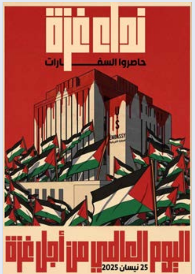
يتعرّض القطاع منذ أكثر من سنة لإبادة جماعية تُنفذ بأسلحة أميركية

صدر أخيراً نداءً موجّه إلى شعوب العالم، والنقابات، والحركات الطلابية، والمبادرات الشعبية، يدعو إلى محاصرة جميع السفارات الأميركية في 25 نيسان (أبريل)، دعماً لغزة وشعبها الذي يتعرض لإبادة جماعية. وأشار البيان إلى أن أكثر من مليوني إنسان في غزة يتعرضون، منذ أكثر من ثمانية عشر شهراً، لـ«هجوم منظم يستهدف كل مقومات الحياة، وإبادة جماعية تُنفذ بأسلحة أميركية، وبغطاء سياسي أميركي، وبصمت دولي يشبه التواطؤ الكامل». وأضاف البيان، مؤكداً أن «التحركات الشعبية حول العالم أثبتت قدرتها على فضح الجرائم ورفع كلفة التواطؤ، لكنها تحتاج اليوم إلى تصعيد واضح ومباشر نحو مركز القرار الدولي الداعم للإبادة: الولايات المتحدة».