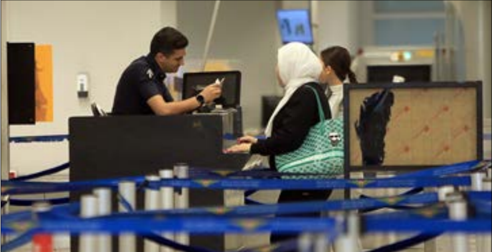
لم تضع الدولة دولاراً من عقد التشغيل الأول (هيلم الموسوي)

وفي نصّ مشروع العقد، ستلتزم الشركة بتأمين مخزون من قطع الغيار في مطار بيروت، وستقوم سنوياً بالتعاون مع المديرية العامة للطيران المدني وفي إجابته على أسئلة وزير النقل والأشغال العامة فايز رسامني لمديرية الطيران المدني حول العقد وسامني رضائي مع «بلاك دلتا»، يؤكّد سعد أنّ «رسامني لم يرفض العقد، بل طالب بالسير في توجيهات هيئة الشراء العام». ويدافع سعد عن صحة إجراء عقد رضائي مع شركته بالتاكيد على أنّها تمتلك حصيرة تمثّل الشركة الألمانية المصنّعة للبوابات Magnetic Access، فلا يمكن تقديم خدمات تشغيل وصيانة