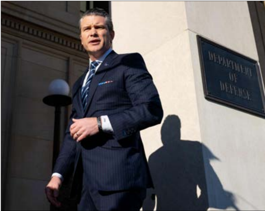
ميجسبت يحاول تهدئة القلق من الاستنزاف في اليمن

أدى نجاح اليمن في الاستمرار في استهداف الأصول الأميركية في البحر الأحمر، إلى قلب الموازين الاستراتيجية والتكتيكية الأميركية القائمة منذ الحرب العالمية الثانية في وقت حساس جداً داخل الولايات المتحدة، التي تخوض صراع وجود مع الصين، وذلك بواسطة سلاح غير تقليدي، سهل الاستخدام وقليل التكلفة، بالاعتماد على الطائرات من دون طيار والصواريخ الموجهة التي أظهرت للعالم قوة غير مأهولة بإرادة تصارع من أجل قضية عادلة وحقة هي القضية الفلسطينية، ليكشف التكتيك اليمني المتكور عقم الاستراتيجية الأميركية المتفوقّة بالنيران ولكن العاجزة عن تحقيق الأهداف، رغم مرور سنة ونصف على بدء العملية على البلد. وسما قالت مجلة «ناشيونال إنترست» الأميركية، فإن الرئيس الأميركي، دونالد ترامب، سيقبل مثل سلفه، جو بايدن، مع تحذير لهذه الدول الردع الأميركي ضد الحوثيين إذا لم يجد طريقة لحل المشكلات التي أعاققت العمليات في عهد الأخير، وقد ترأس ترامب ما يمكن فعله، بأن عزّن ترسانته العسكرية بأحدث الوسائل المتعدّات بشكل غير مسبوق، ويرسل تهديداته عبر الوسطاء كما فعل