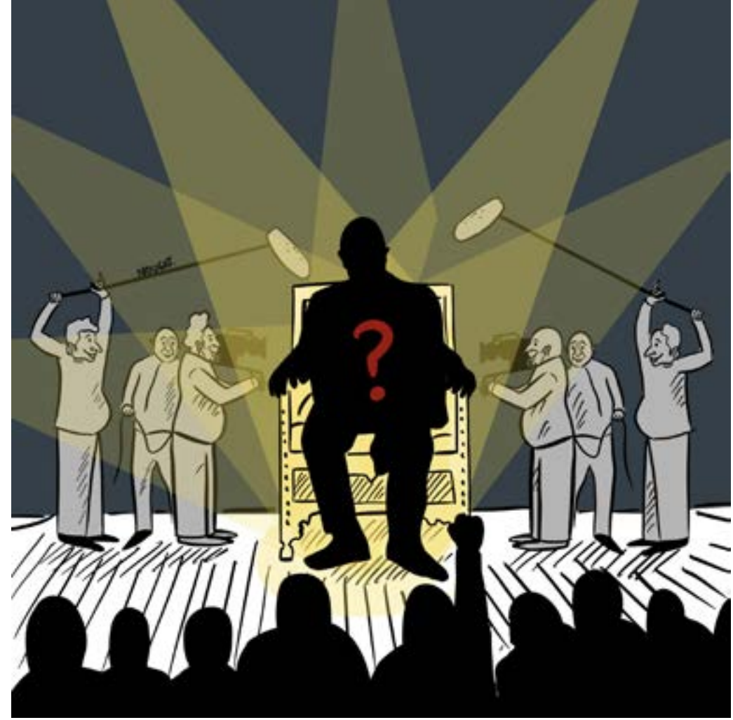
(نهاد علم الدين)

تتضمن البث المباشر لجلسة مجلس النواب التي ستفتتح صباحاً (09:00) في وسط بيروت، وما تحملها من مفاجات من ناحية التصويت والفرز. أما المرحلة الثانية للبرمجة، فسيتم تفعيلها في حال تمّ انتخاب رئيس الجمهورية وملء الفراغ الرئاسي. عندها، ستطلق وسائل الإعلام اللبنانية مجموعة برامج جديدة، ستكون مهماتها إلقاء الضوء على الرئيس الجديد، وخلفياته السياسية