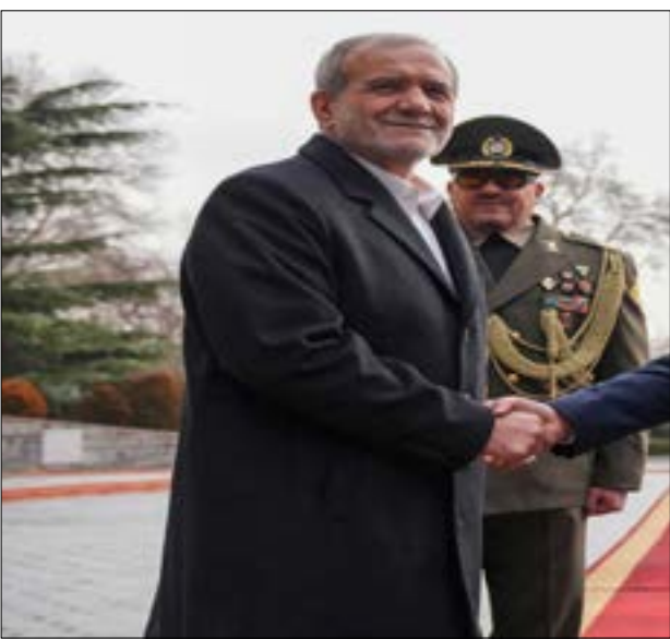
استعرض برئيسكياك والسوداني الإجراءات المتخذة من قبلهما لتصفية مخدرات التفاهم بين الجانبين