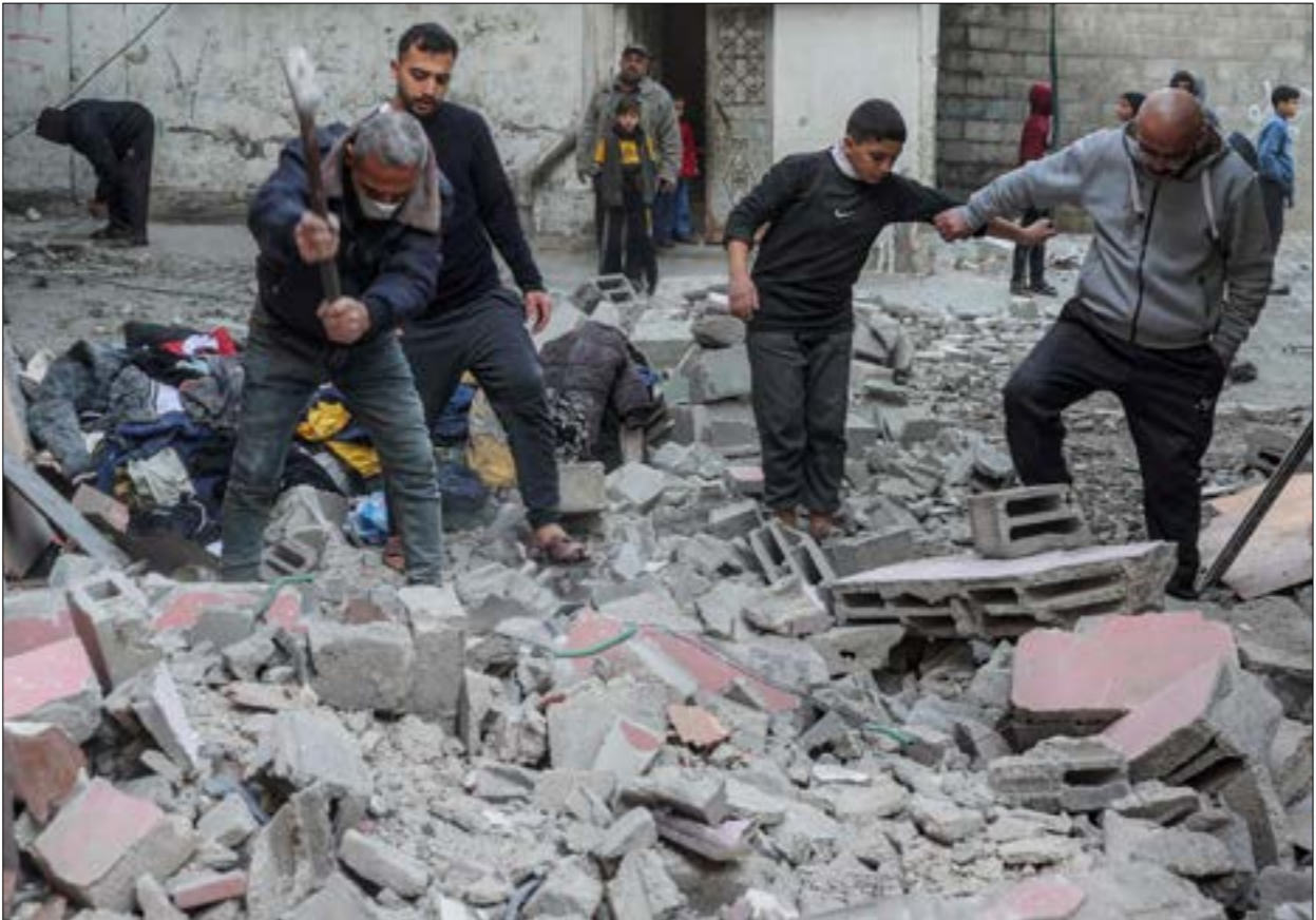
يرد الاحتلال الأبيض حرا على حجر في غزة

مجنزات كبرى في القضاء على البنية التحتية لفصائل المقاومة».