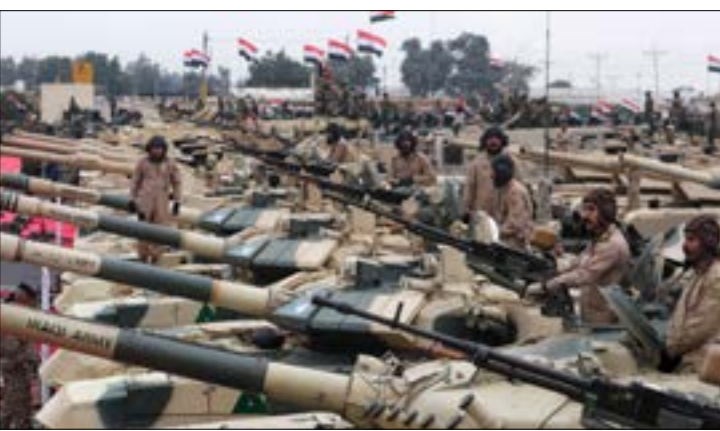
الجيش العراقي يحتفل بالذكرى الرابعة بعد المئة لتأسيسه

أخيراً، بالموافقة الغورية، وقد بدأت الاستقالات، من وزارات حكومة تصريف الأعمال التي يرأسها محمد البشير،