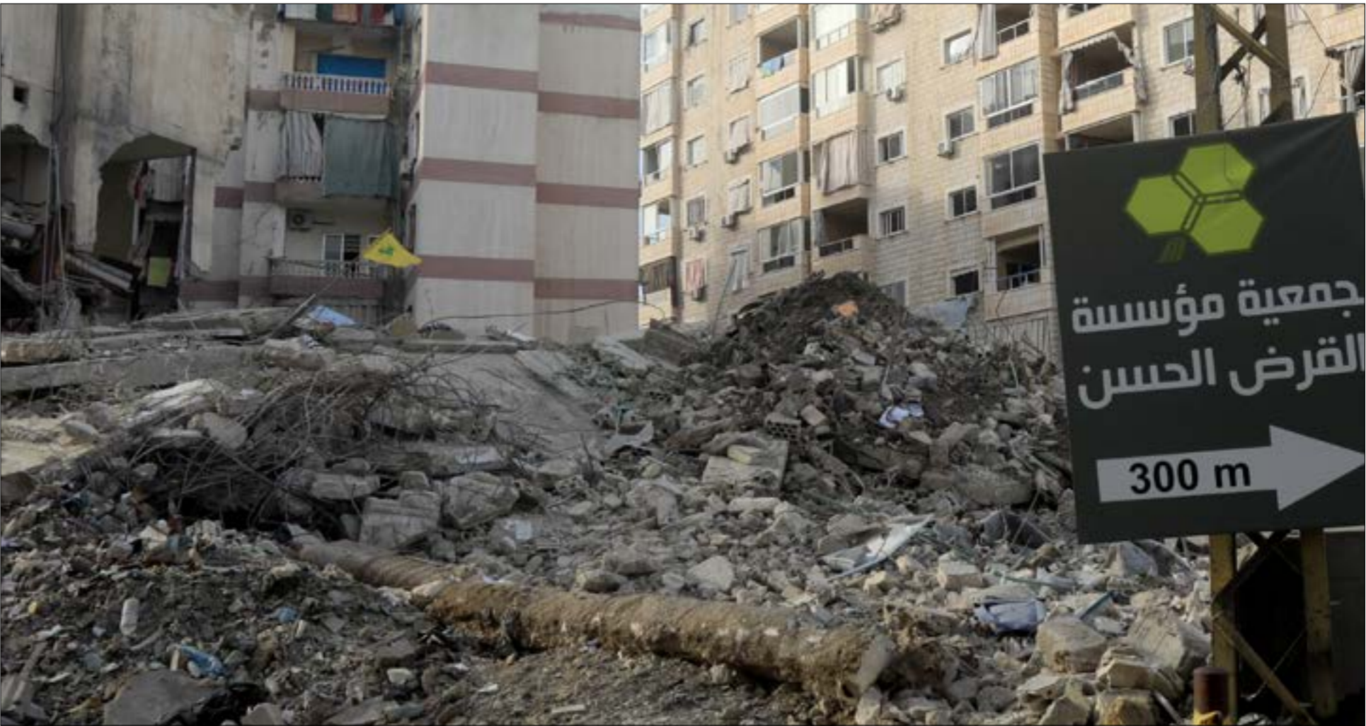
شملح مسح الأضرار خالك 40 يوما 247 الفوحدة سكنية وسدّد 120 مت قيميها(هيلم الموسوي)