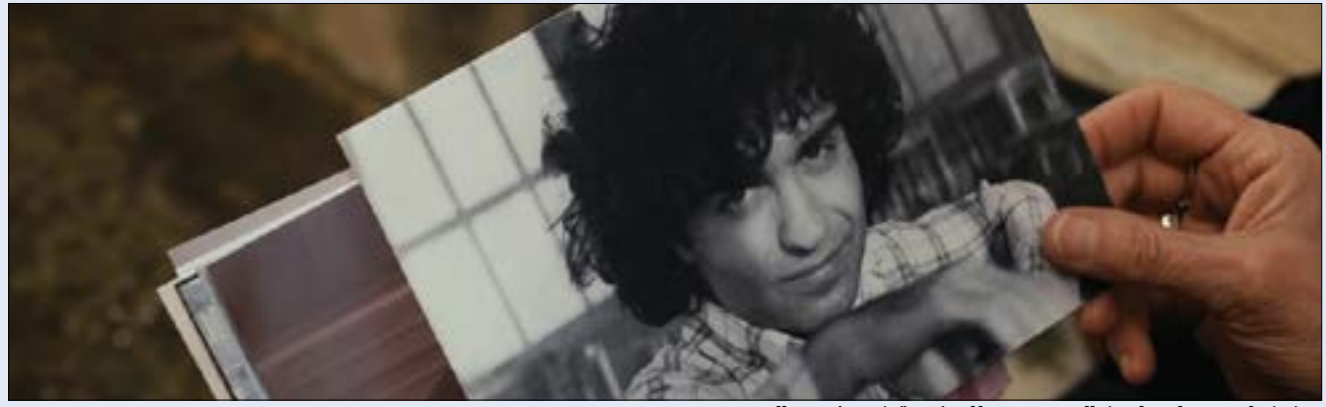
من فيلم «وعاد مارون إلى بيروت» للمخرجة فيروز سرحال