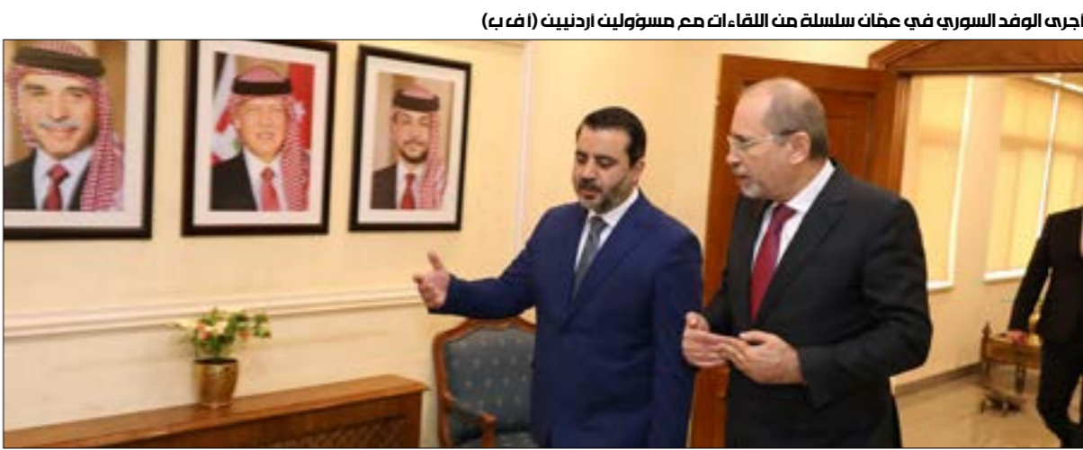
اجري الوفد السوري في عتق سلسلة من اللقاءات مع مسؤوليأردنية(ف ر ب)

موعد عقد مؤتمر للحوار الوطني، كانت قد أعلنت عنه سابقاً، إلى أجل غير مسمى. وأرسلت أنقرة، التي كان وزير خارجيتها، حاقان فيدان، احتفل بسقوط النظام السوري على قمة جبل قاسيون في دمشق، عشرات الوفود الحكومية لاطلاع على واقع المؤسسات السورية، وفرض