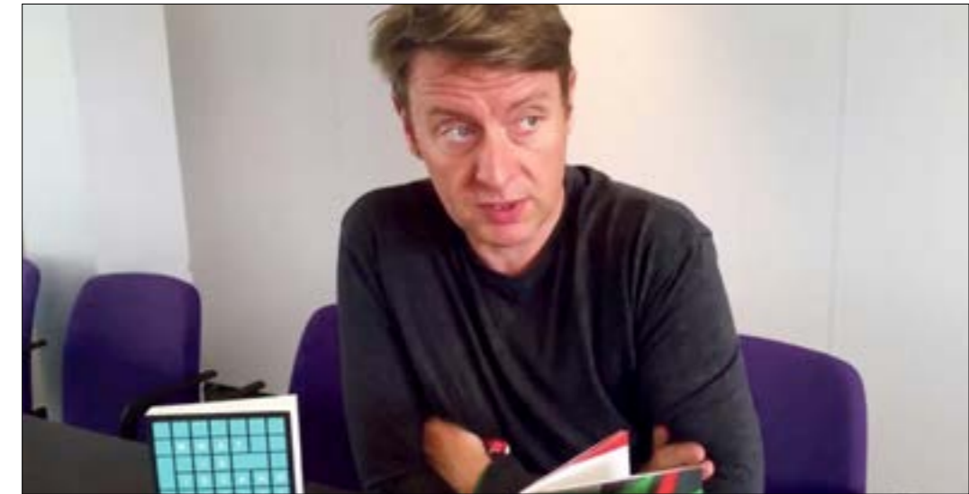
اعتبر ديفيد ميلر أنّ الصهيونية من المسبات الأساسية للإسلاموفوبيا

مماثلة. وجدنا أنه قد أثبت أن المعايير أوفي بها، واعتقاده يرقى إلى اعتقاد فلسفي». وفي نسخة أخرى للوبي الصهيوني ومساعدته إلى فرض قناعاته على المستوى العالمي، وجدت المحكمة أنّ «الصهيونية تعني أشياء مختلفة لأناس مختلفين وليس لها تعريف عالمي». وعروض ترهيب وقمع كل فكر مناهض للصهيونية، خلصت المحكمة إلى أنّها «تستخفّج رواية المدعي في ما يتعلق بطبيعة الصهيونية في على الأقل متماسكة ومقنعة، المدعي أكاديمي ذو خبرة في الصهيونية والحركة الصهيونية. وقد أشار في أدلته إلى عدد من الأعمال الأكاديمية التي تدعم وجهة نظره حول طبيعة الصهيونية، وبطبيعة الحال، نحن لا نؤيد هذا التحليل أو نعلق عليه بأي شكل من الأشكال.