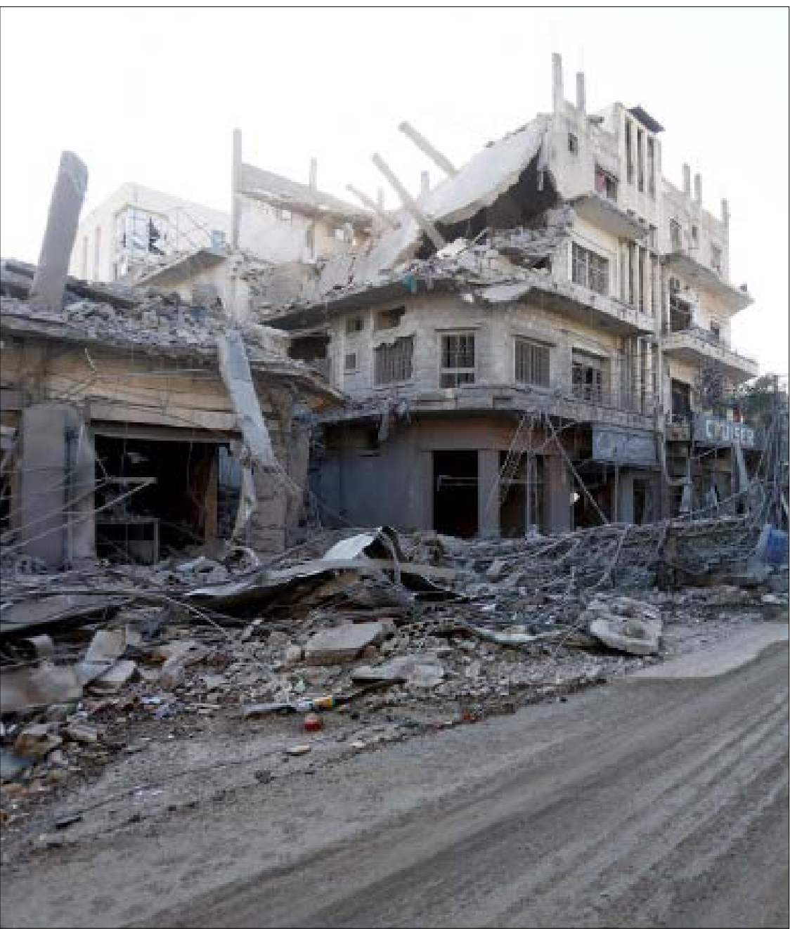
دمار في النبطية (حزبان) (نوح جندر)

ويبدو أن المقاومة تبعت برسائل من خلال هذه الاستهدافات حول شكل المرحلة المقبلة التصاعدية، والتي بدأت باستهداف القواعد العسكرية الرئيسية والحساسة في منطقة حيفا، وهو ما يدلّل على القدرات التسلّحية والعملية التي لا تزال تتمتّع بها المقاومة، رغم ضراوة القتال وكثافة الغارات الإسرائيلية على غالبية المناطق اللبنانية، ما يكذب مزاعم العدو بأنه تمكّن من القضاء على قدراتها النوعية والاستراتيجية،