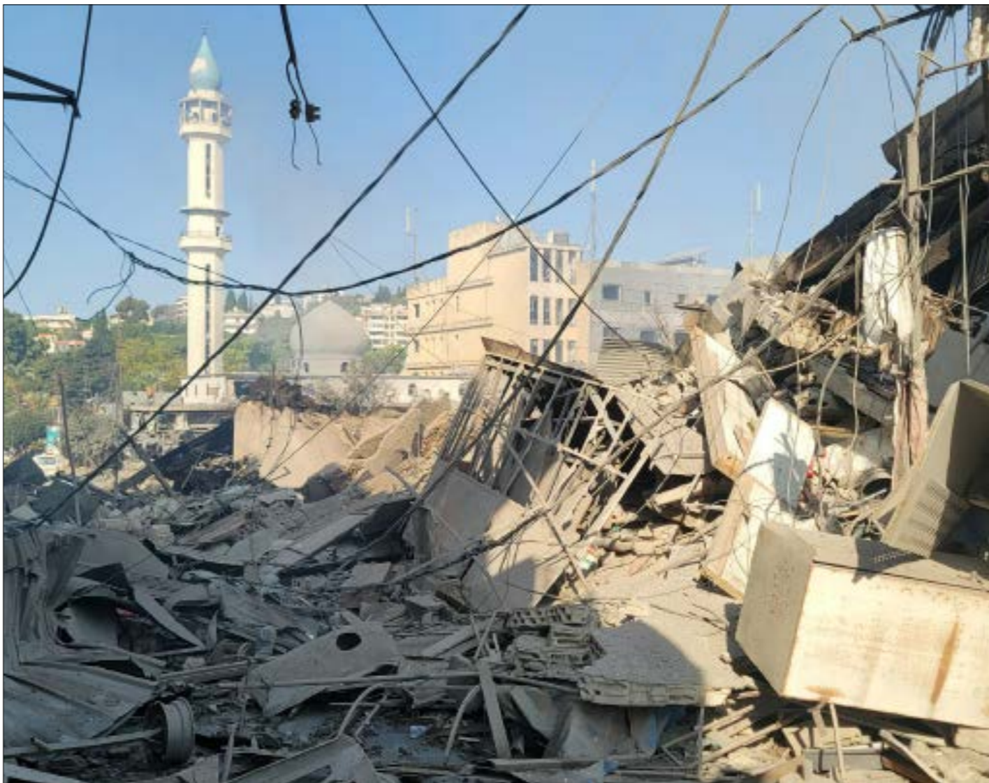
صورة تظهر الأضرار التي خلفتها غارة إسرائيلية استهدفت سوق مدينة النبطية

جهل عميق بالواقع اللبناني، ومن وهم باتّه بات بالإمكان «إخراج» حزب الله من المعادلات الداخلية اللبنانية. وفي مقال أوردته مجلة «نيوزيوك» الأميركية، يطلب الكاتب دان نيسري، وهو محرر شؤون الشرق الأوسط السابق في وكالة «سوشيفيتد برس»، من القارئ أن يتخلل دبلوماسيين في غرفة يديعت منها الدخان في زمن الحرب في لندن وباريس، يتفحصان خريطة الإمبراطورية العثمانية، في إشارة إلى خريطة «غير مُساعدة» للشرق الأوسط الذي نعرفه اليوم. ويرى بيري أن جذور الاضطرابات آنذاك بريطانيا، وفرنسا جورج بيكو. وعلى الرغم من أنّ الرجلين لم يكونا، على حدّ تعبيره، رسامي خرائط مشهورين أو من الخبراء الكبار في شؤون الشرق الأوسط، فقد