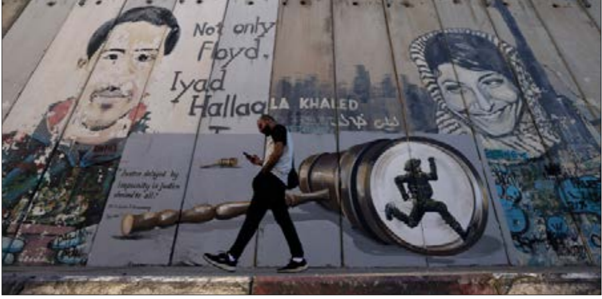
دفع جيش الاحتلال بعشرات الجنود لتدعيم فرقة الضفة الغربية لحماية المستوطنات ومنطقة جدار الفصل العنصري