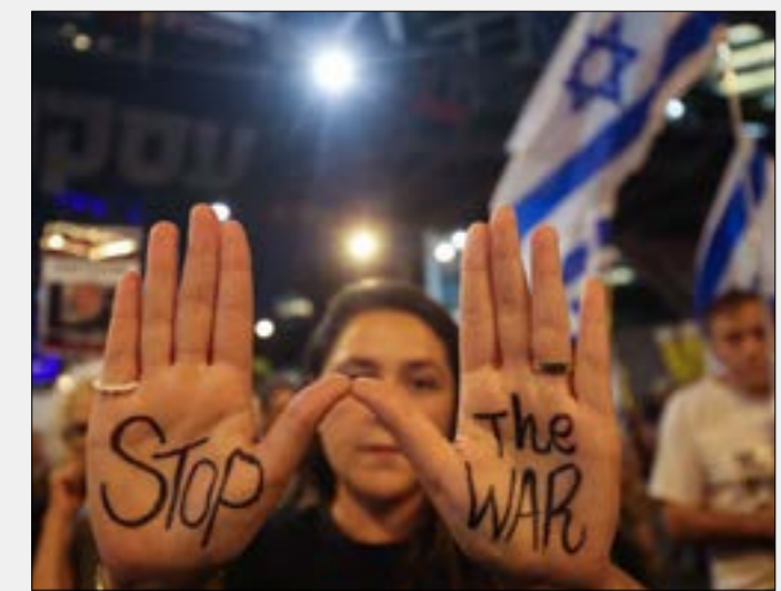
معضلة إسرائيل ان حجم الضغوط على جمهور المستوطنين بات اكبر

على الساحة الإيرانية، لا تبدو فرص إسرائيل أفضل مما كانت عليه، خاصة أن ما طرا على هذه الساحة لم يكن في وارد تقديرات الكيان لدى بلورته قرار تنفيذ الاعتداء في طهران. فإضافة إلى إخفاق تل أبيب في تقدير ردة الفعل الإيرانية، ربما أسهم الاعتداء في دفع الجانب الروسي إلى التدخل في الحرب عبر تعزيز القدرات الإيرانية - وفقاً للأبناء، المشاعة بهذا الخصوص -، وهو ما كان موضع تردد لدى موسكو طوال الأشهر الماضية، رغم المصلحة الروسية المباشرة في إسناد «أعداء الأعداء»، وفي حدّ أدنى وفقاً للمعاملة بالمثل. أما في ساحة غزة، حيث تكمن بداية أي حل، فالواقع، أن صفقة التبادل قد تجمدت بالفعل، من دون وجود تقديرات باستئناف المفاوضات غير الشكلية والإلهائية قريباً. علماً أن مباشرة هكذا مفاوضات، بل والتوصل اللاحق إلى تسوية ما من شأنها التهديد الفعلي لإنهاء الحرب، هو ما يجب على إسرائيل والولايات المتحدة المبادرة إليه، إن أرادتا تسويات في جبهات المساندة. وهو ما يجب أن ينتظر، بدوره، تبلور النتيجة التي ستنتج أكثر في اليوم الذي يلي تبادل الضربات.