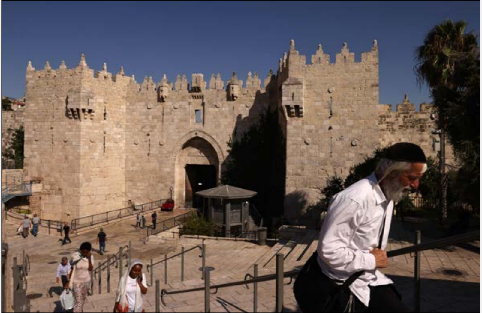
تخدم إخطارات الهدم الجديدة التي وُزعتها بلدية الاحتلال، مشروم «وادي السيليكون»، الذي تملكه عليه إسرائيل

السكانية الفلسطينية في المدينة، وتطويق الأحياء الفلسطينية وتقسيمها وفصلها. ويدرك الفلسطينيون، من جهتهم، مستغلين خلوه من القدس تضي نحو تغيير الواقع الديموغرافي والضعف الجوي في المدينة، بحيث يقل عدد سكانها، في مقابل توسيع مساحتها، لتصبح 10% من مساحة