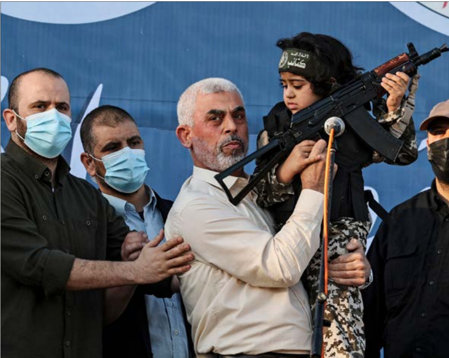
الخيار اللت هو لرمع مسوبه التحدي