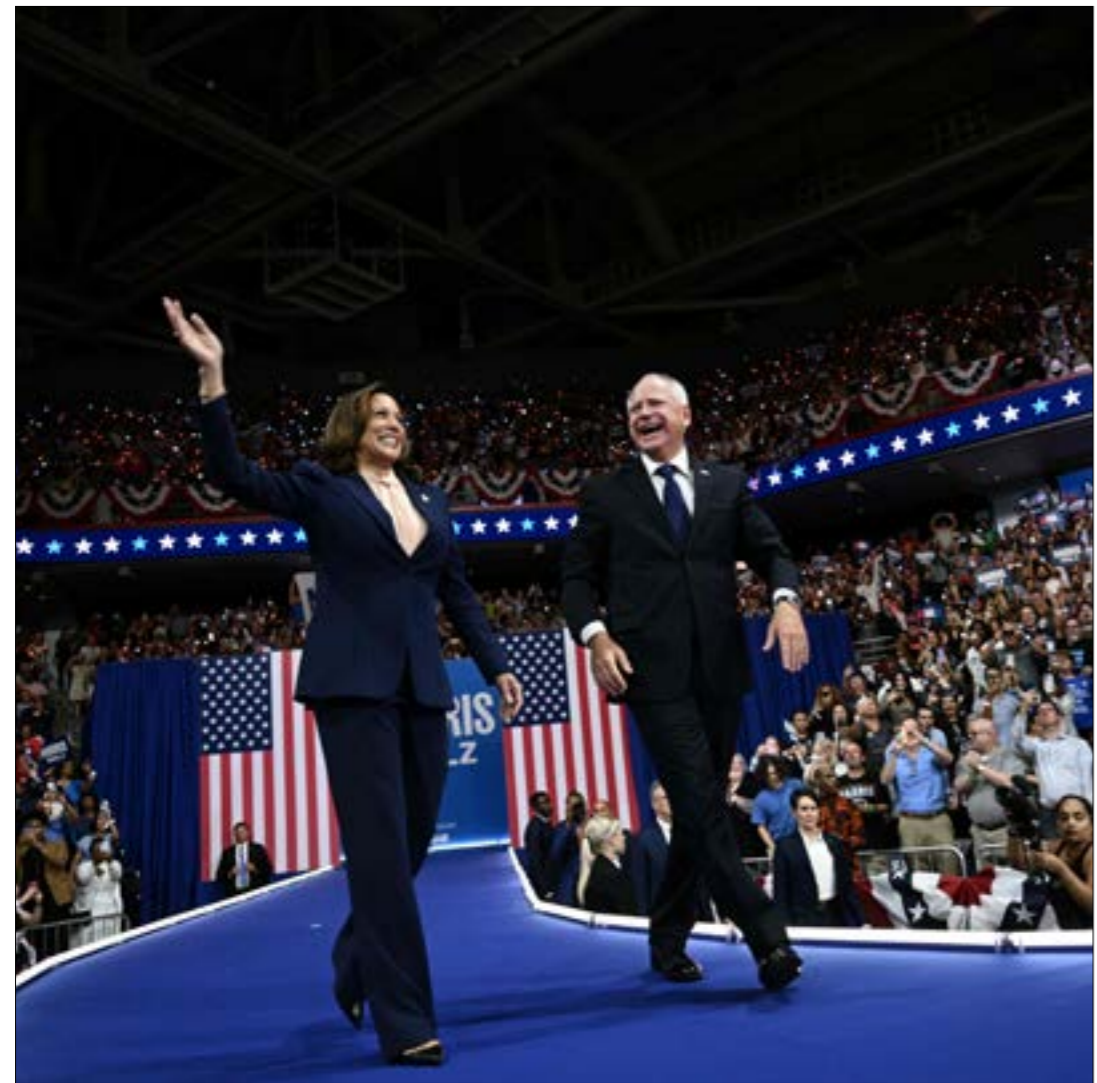
خلال التجمع الانتخابي الذي أقيم في ولاية فيلادلفيا، بدأت هناك، «انسجاماً»، واضحاً بين هاريس وولز

وتحوّل وولز، الذي كان، في بداياته، عضواً مؤيداً لحمل السلاح في منظمة «الاتحاد القومي للأسلحة»، إلى «اليسار» خلال مسيرته السياسية، ووضّع خلال ولايته «جدول أعمال» تقدّمياً، لا لبس فيه، طبقاً لمراقبين،