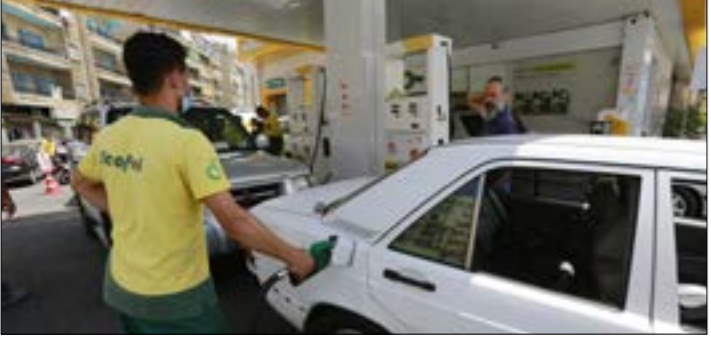
(هروا بو حيدر)

الذي تنتهجه في مواجهة هذا الارتقاء العملياتي. وفرض إعلان السيد نصرالله بأن القرار انتقل إلى مرحلة التنفيذ بحسب ظروف الميدان، على قادة العدو وأجهزته