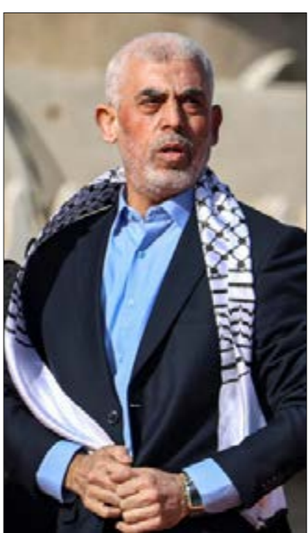
تقدم السنوار خطوات لم يجز احد على السبيل بها

كان الهدف من اغتيال هنية هو الدفع بالفلسطينيين نحو حال من الإنكفاء، من شأنها العودة بهم إلى مناخات «الخوف» و«الهزيمة» التي لطالما شعروا بها في أعقاب انكفاء «منظمة التحرير الفلسطينية» منذ عام 1988، ثم وصولاً إلى «عام أوسلو» وما تلاه. لكن ما حدث هو العكس، وإذا كانت الصور غالباً ما تقاس بالنتائج التي يمكن أن تفضي إليها، فإن إسرائيل قد تكون ارتكبت خطأ بالغا في حساباتها تلك. فالفعل زاد من تاجيح مشاعر الفلسطينيين الوطنية، وزاد أيضاً من حماسهم للحرب والنضحية. وفي قلب آخر، كانت المساعي الإسرائيلية لتشويه صورة السنوار داخل حركته، وفي الذات الفلسطينية عموماً، باتت بفشل ذريع، الأمر الذي يثبت بيان الحركة الذي كرس الأخير زعيماً لحركة باتت تحظى بتأييد كامل غزة و64% ممن يعيشون في أراضي الضفة الغربية.