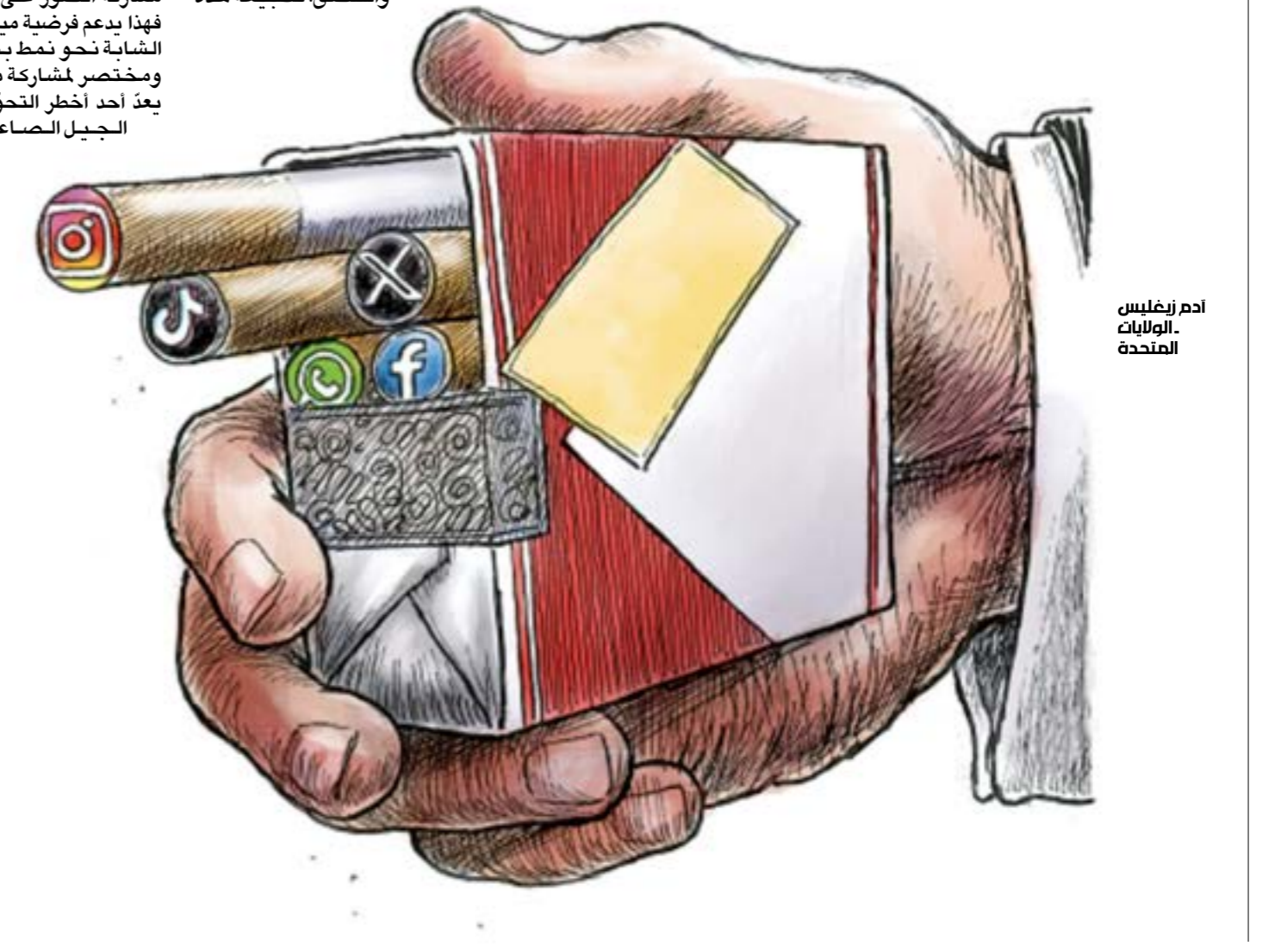
ادم زغبليس الولايات المتحدة

بصير العالم الافتراضي هو العالم الأساسي في حياتهم، فلا تكون هناك «عودة إلى الواقع على الأقل ما دام المرء متصلاً بالإنترنت» على قول روا. فهل تحوّلت حياة الشباب إلى عوالم افتراضية مفتحة ذاتياً، حيث «ضراوة الاستقطاب» والأرض التي تدور حول كمية المعجبين، وحيث لا يرى الفرد نفسه إلا عبر عيون الآخرين؟ فتحت مواقع التواصل الاجتماعي الباب على جدليات كثيرة لا بد من حفریات متعددة الطبقات للإجابة عنها أو مناقشتها بالحد الأدنى، فلم يعد ممكناً الحديث عن ثقافة مكتسبة أو شهرة متراكمة أو طبيعة محتوى وتيرة مشاركة أو حيز مكان افتراضي دائم من دون اللولج إلى النفس البشرية وسلوكياتها التي