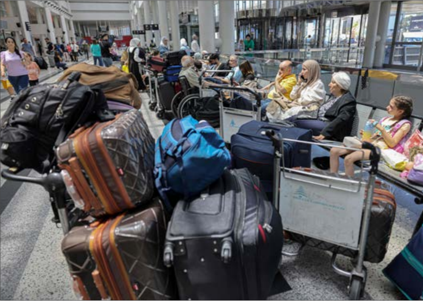
مسافرون في مطار بيروت امس بعد الغاء رحلاتها

المفارقة، ما يؤكّد على صلابة الموقف الذي حكم المواجهة منذ أشهر. وفي ذلك باتي التفصيل: أولاً، كما هي الحال دائماً، منذ أشهر، يتعلق قرار الحرب الإبتدائية الإسرائيلية في الساحة اللبنانية بمعادلة الكلفة والجودى، وحكامة