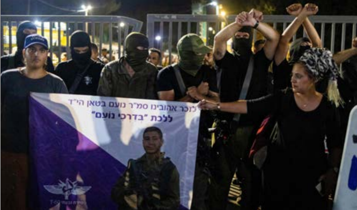
تمكّن المستوطنون المحتجّون من اقتحام المحكمة العسكرية في قاعدة «بيت ليد، (ا ف ب)

وبعد وقوع المواجهات والضجة التي أثيرت حولها، أعلن جيش الاحتلال أن «الحدث في سديه تيمان انتهى، وأن الشرطة العسكرية غادرت المكان، وتم توقيف من تعيّن توقيفه، ولا يوجد معتقلون»، وهذا كان توقيفاً من أجل التحقيق». وأصدر