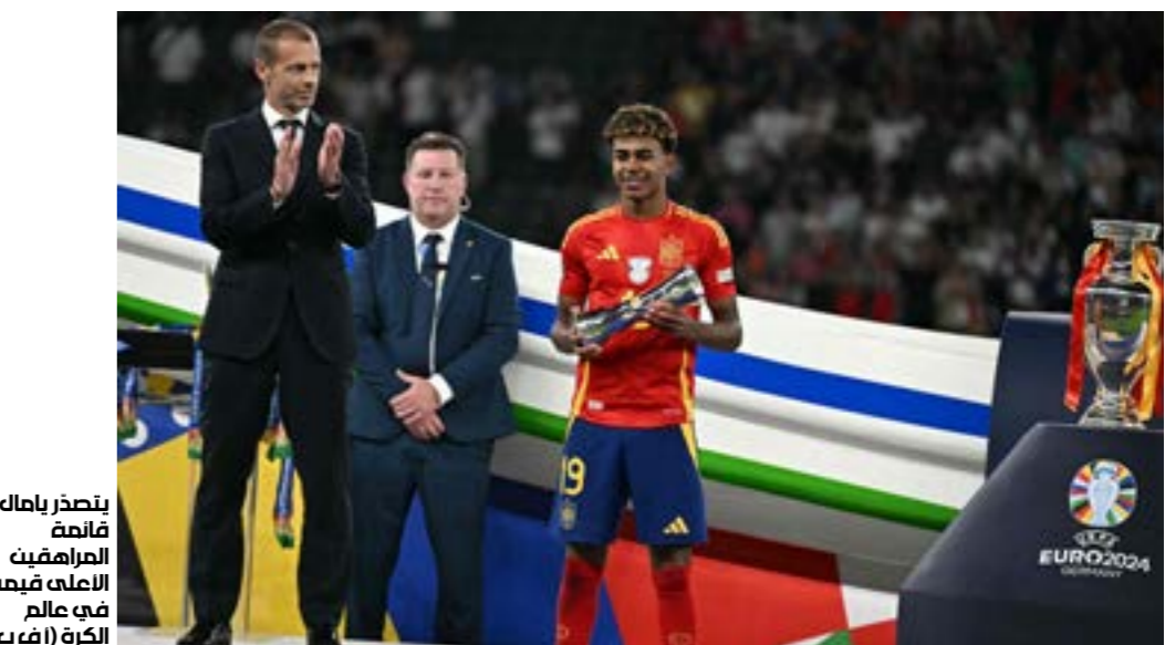
يتصدر يامل قائمة المراهقين الأعلى قيمةً في عالم الكرة

غافي كان قد شقّ طريقه إلى الفريق الأول وفرض حضوره سريعاً، تماماً كما هو حال لاعب وسط باريس سان جيرمان وارين زاتير - إيمري (18 عاماً) الذي بدأ أكبر من سنه، فتضاعفت قيمته في ظرف سنة بتبع 90 مليون يورو، وذلك رغم أنه غاب عن غالبية مدد الموسم الماضي وعن كأس أوروبا بعد تعرضه لإصابة قوية يؤمل ألا تتكرر أنزها السلبلي على مشواره الكروي. الأخيرة.