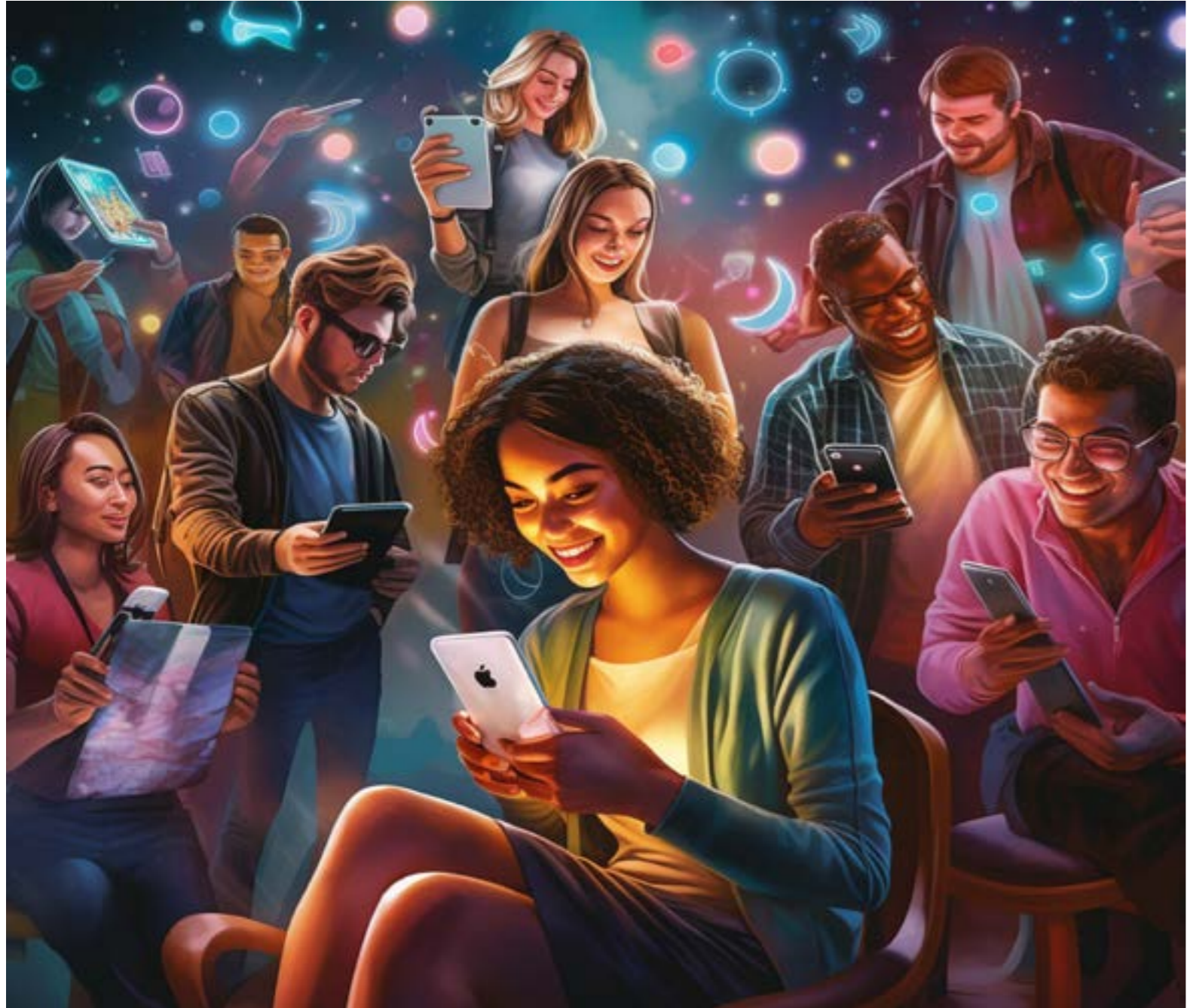
Blade Runner 2049 تحدّي للبارية

عكس الإنتاجات الثقافية التقليدية مثل المسرح والسينما والموسيقى والصحف التي كانت الأجل السابقة، تدفع في مقابل الحصول على ميزات، لكن على الضفة الأخرى مما نختبره يومياً، تبرز إيجابية واحدة كبيرة في مواقع التواصل الاجتماعي بعد «طوفان الأفي» في السابع من تشرين الأول (أكتوبر) الماضي. فقد منححت هذه المنصات الطلاب فرصة التعرف على حقيقة العدو الإسرائيلي وعن كتب، على اعتبار أن معظمهم لم يخبثروا حروبه وهمجته عن قرب. استطاع المحتوى المعتم والمشارك بشكل لحظوي إنعاش أذهانهم في ما خص القضية الفلسطينية، بعد غرقهم في أدوات التسلية الافتراضية في أولى سنوات وعيهم للعالم من المستخدمين يواجهون تغرراً في الإسناد الثقافي وفي مرجعياتهم التقليدية، أي إنّ هناك انعداماً للامن الثقافي الذي شخصه عالم الخطر لوران بوفيه. وهنا يكمن الخطر الأساسي في مواجهة ما سببها روا «ثقافة استهلاكية منزعجة من سياقها ومن تاريخها وقائمة على تقنيات إنتاج الصورة والصوت، وهي متاحة للجميع من دون تلقين سابق، عبر وسائل إنتاج وانتقال في المتناول اقتصادياً». أي إنّ جزءاً من خطورة المحتوى القائم على «الإخراج الدعائي» واتوحيد صورة السعادة ونمط المشاعر وتسلبيها» هو مجانيتها وسهولة الوصول إليه، على