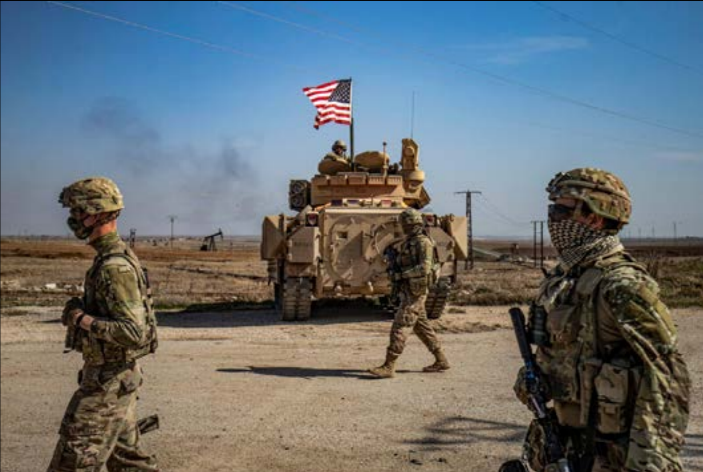
اتت الاستهدافات الأخيرة بعد أكثر من اربعة اشهر من الهدوء النسبي

وضع الفصائل الموالية للولاي جنوبي اليمن وغريميه. وأقادت المصادر بأن رئيس الإمارات، محمد بن زايد، أوفد مبعوثاً إلى السعودية حيث التقى ولي العهد، محمد بن سلمان، وطرح عليه رؤية بلاده بشأن الوضع في الجنوب. ومن بين المقترحات الإماراتية، وفق المصادر، تشكيل حكومة جنوبية تخضع لإدارة أبو ظبي، مقابل دعم الأخيرة لاتفاق التهيئة الاقتصادية. وأشارت المصادر إلى أن «مطالب المؤنذات الحضرمية تتمثل في أن نفط حضرموت لحضرموت، بينما تجري مفاوضات على أن تتم إعادة