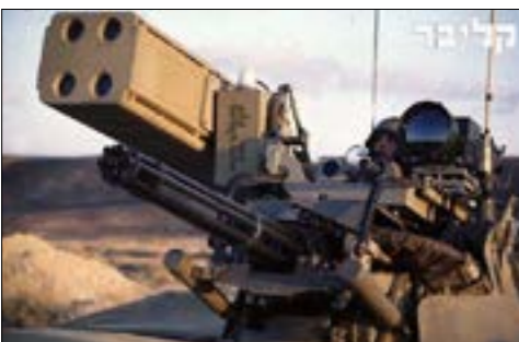
تستعد القوات الإسرائيلية قريبا لنشر مدمر فولكان في عدة مواقع على طول الحدود الشمالية لتعزز ادوات النعمة مع الطائرات المسيرة التابعة لحزب الله

واصل حزب الله أمس عملياته على الجبهة الجنوبية «إسناداً لغزة» ودفاعاً عن لبنان»، فاستهدف أمس موقعي الرمثا والسماقة في تلال كفرشوبا. وبدأ على اعتداءات العدو الإسرائيلي التي طاولت المدنيين في بلدة عدلون، استهدف الحزب مستعمرة دنفا بصواريخ الكاتيوشا. كما ردّ على الاعتداءات على بلدتي عدلون وحولا باستهداف مقر قيادة الفيلق الشمالي في قاعدة عين زيتيم بصواريخ الكاتيوشا، وبشن هجوم جوي بسرب من المسيرات الانتقاصية. استهدفت القنر المستحدث لقوات العدو في مستعمرة حانيتا، وأصابته نقطة تجمع الجنود فيه بشكل مباشر، موقعة فيهم إصابات مؤكدة بين قتيل جريح. ولاحقاً، أعلن المتحدث في جيش حانيتا ويعرا بالجليل الغربي واندلاع حرائق في المنطقة.