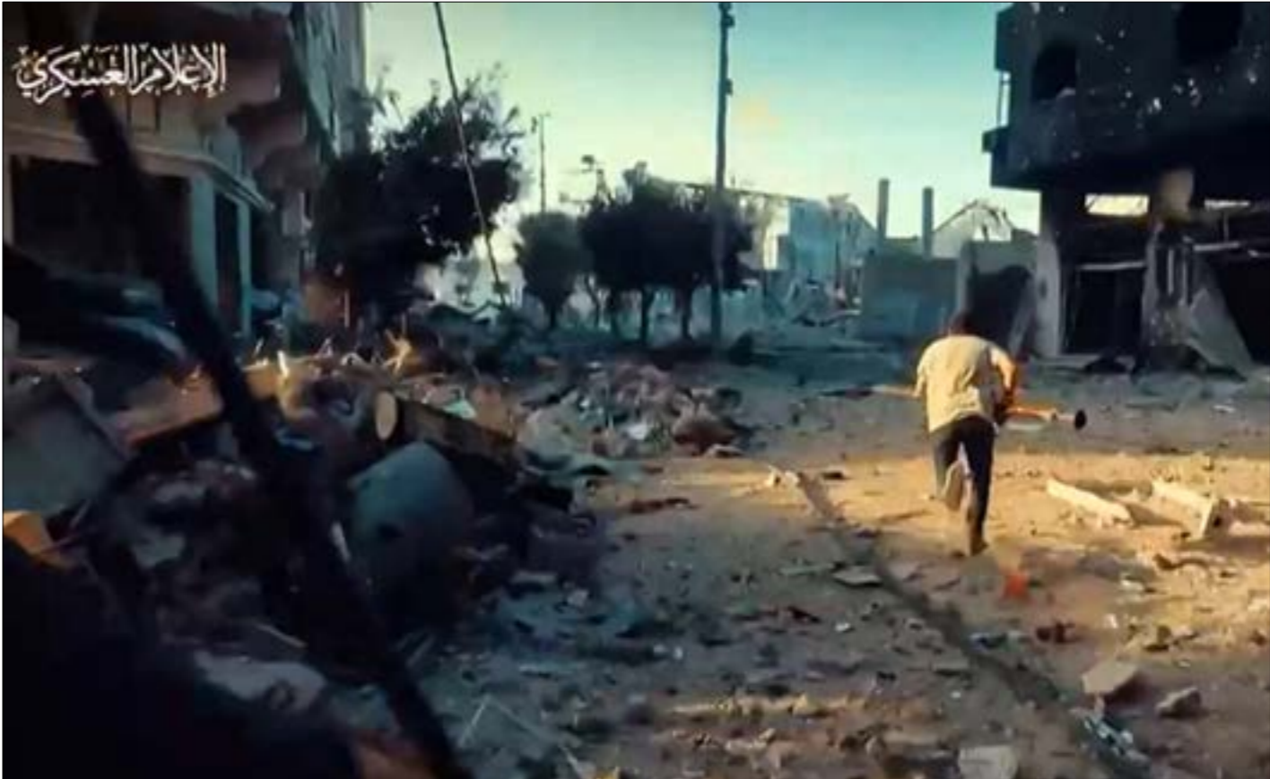
الكثير من العمليات أظهرت أن المقاومة استطاعت تطويع جغرافيا الحرب لمصلحتهم

لقد رفعت المقاومة أثماناً كبرى، خصوصاً على الصعيد المعنوي في بعض المراحل، لكنها استطاعت، بـ«مبدأ المرونة»، أن تكسر الارتباط الشرطي بين التوغّل البري والهزيمة، وتجنّدت تكتيكاتها القتالية،