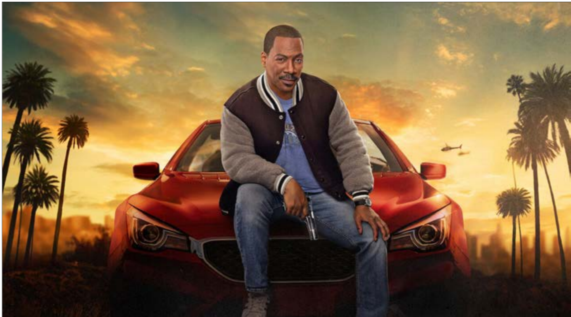
بكتباها: شفيق طيارة