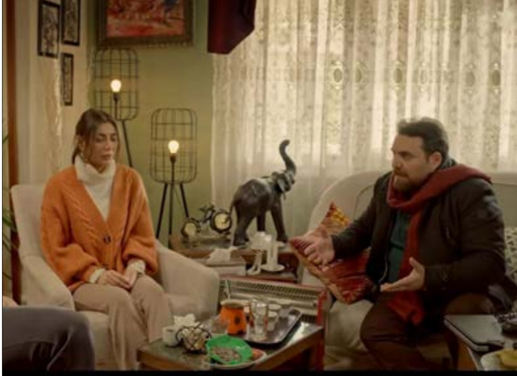
من مسلسل «مغتربون»