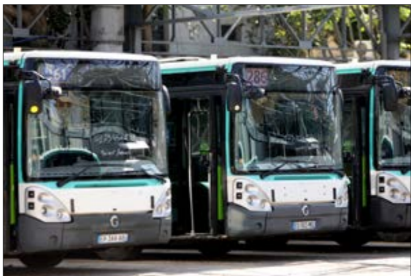
الإيرادات المحصلة للإدارة هي 10% قبل حسم النفقات التشغيلية (هيلن الموسوي)