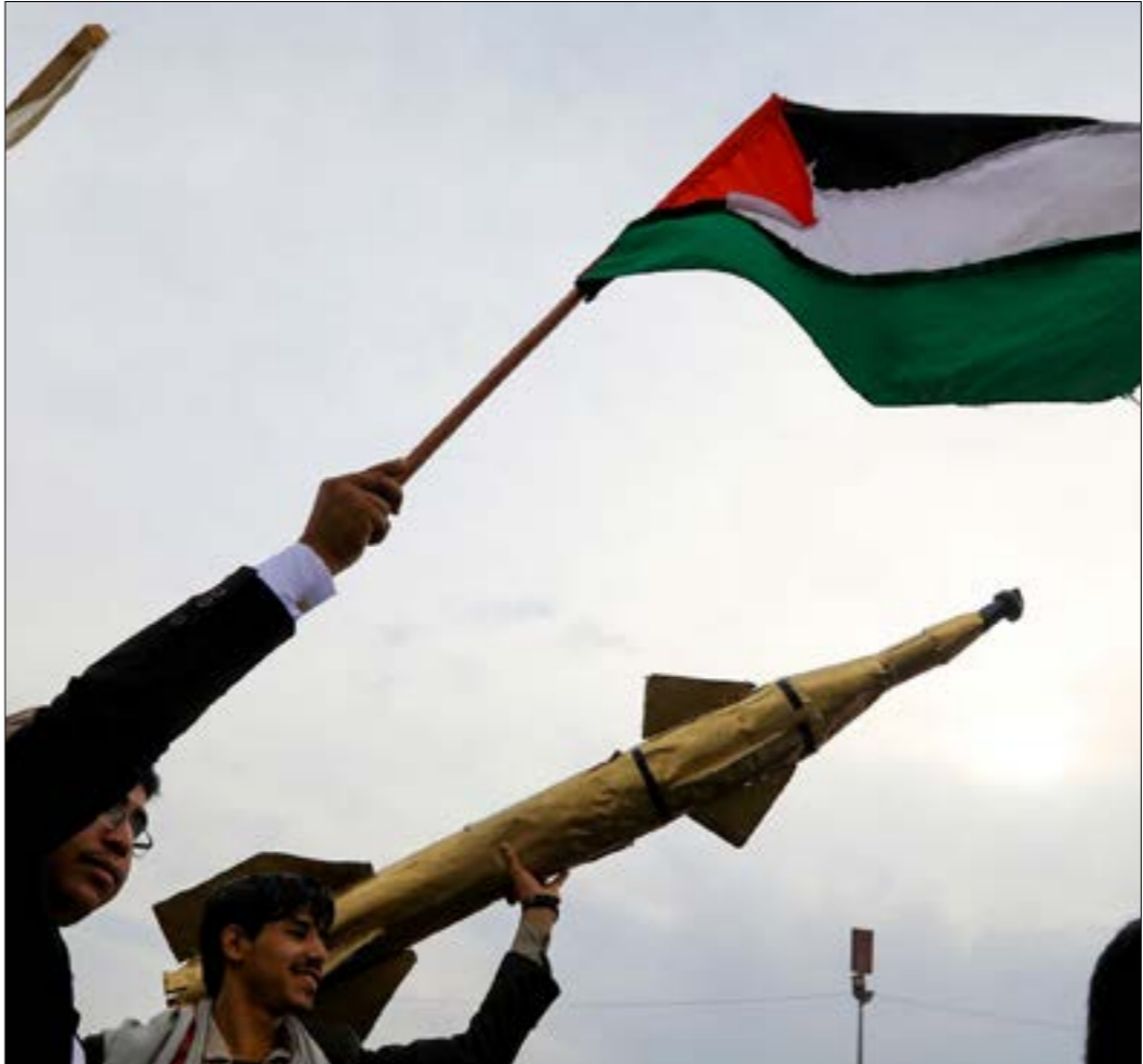
الحوثيّ: أميركا لن تنجح في إيقاف عملينا المساندة للشعب الفلسطيني، (أ ف ب)

في صنعاء، عزيز راشد، لـ«الأخبار»، أن «التحسيس بين قوات صنعاء والمقاومة العراقية قائم على مستوى عالٍ منذ أشهر، والتواصل يجري بشكل يومي»، مشيراً إلى أن «مكتب التنسيق الخاص بالحركة موجود منذ فترة في العراق، ولكن صنعاء أزادت أن تُسمع أميركا والسعودية أنها مقبلة على تنفيذ عمليات أعمق وأوسع على مستوى المنطقة، ولن تطاول فقط السكان الإسرائيلي بل ستطاول حماة إسرائيل في المنطقة». وأضاف أن «الرسالة موجّهة كذلك