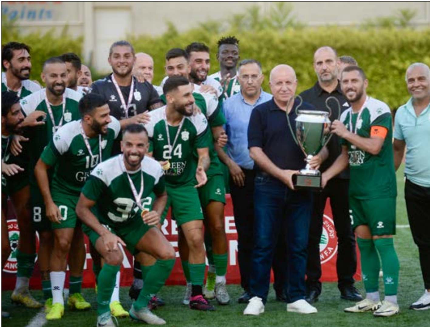
مؤص لاعبو الأنصار بعض الشبه، خسارة لقب الدوري (طلاك سلمان)

إقامة قرعة كأس لبنان ويطولتي الدرجتين الأولى والثانية في 19 تموز المقبل، حيث يتم إعداد نظام فني جديد غير الذي وضع قبل أسبوعين سيدخل عليه بعض التعديلات بناءً على قرار اللجنة التنفيذية في جلستها الأخيرة أول من أمس.