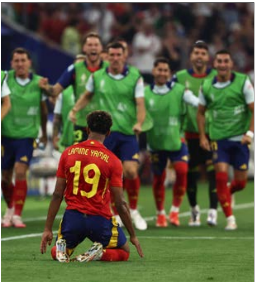
أهز اهك الأسيان بـالجنرال»