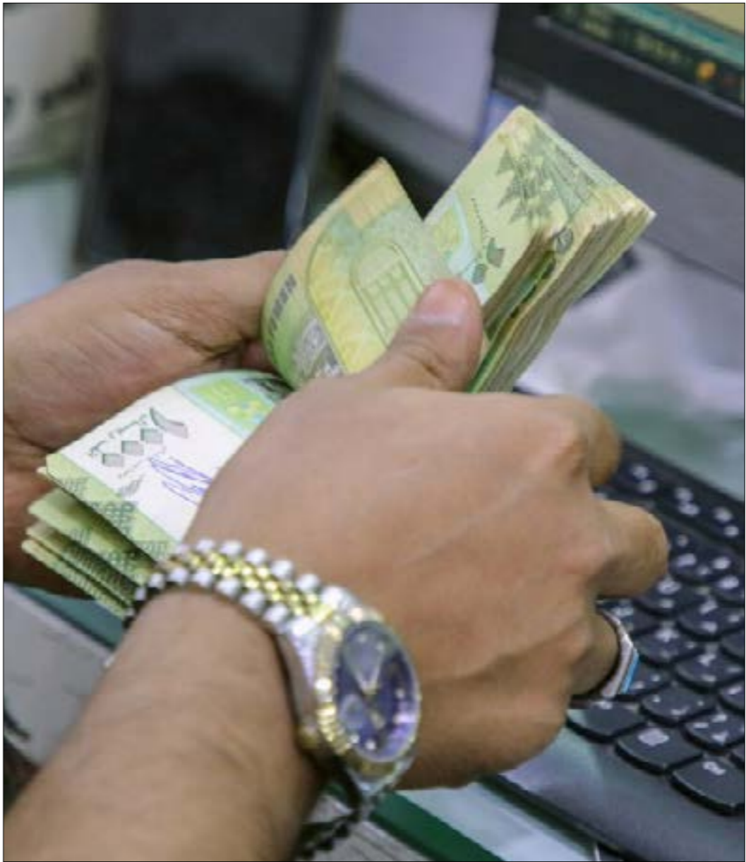
تدهور قيمة الريال المتداول في المحافظات الجنوبية (من اليمين)

إلى العزوف عن التقديم في المزايدات، واللجوء إلى السوق السوداء لشراء الدولار، والاعتماد على تحويلات الصرافين إلى الخارج لتغطية فواتير بضائعهم المستوردة، حتى وإن كانت بأسعار أعلى من أسعار المزايدات. وأرجع تقارير رسمية صادرة عن وزارة التخطيط والتعاون الدولي، بأنه في ظل فشل حكومة عدن في تحسين الأوعية الإيرادية وإيجاد مصادر تمويل لتغطية الموازنة للحد من تصاعد العجز السنوي،