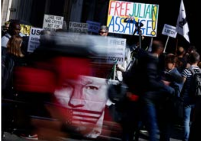
مناصرون لاسانج يتظاهرون أمام المحكمة أمس في لندن

تنفّس أنصار الصحافي الاسترالي ومؤسس موقع ويكيليكس، جوليان أسانج، الصعداء مؤقتاً على الأقل، بعدما قرّرت أعلى محكمة في المملكة المتحدة منحه إنذاراً باستئناف قرار وزارة الداخلية البريطانية بتسليمه للولايات المتحدة، حيث تنتظره اتهامات يبلغ مجموع عقوباتها - في حال إدانته - 175 عاماً في سجن خاص.