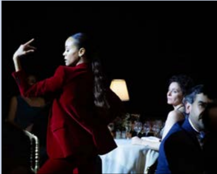
من فيلم «إميليا بيريز»

بعد بداية فاترة تقريباً، ثم الزلزال الذي أحدثه فيلم «ميغالوبوليس» لفرانسيس فورد كوبولا، وصل «مهرجان كان السينمائي الدولي» إلى يومه الخامس من دون فيلم يرقى إلى نيل «السعفة الذهبية». كان هذا الفيلم مفقوداً، إلى أن وصل الفرنسي جاك أوديار مع «إميليا بيريز»، في الثانية والسبعين من عمره، وصل أوديار إلى «كان» وكسر كل توقعاتنا. قفز فوق الهاوية، وغامر بفيلم غنائي، ومسرحية موسيقية حول تاجر مخدرات في المكسيك قرّر تغيير جنسه لتحقيق حلم طفولته. والنتيجة لا يمكن إلا أن تكون منيرة للإعجاب، سواء لمهارة الفرنسي السينمائية، أو لقدرة العبقرية على النقد والإدانة. إذا، أوديار مرشّح بقوة لنيل «جائزة السعفة الذهبية» للمرة الثانية بعد فيلمه «ديبان» (2015) بفضل حبكة مدهشة، وخصوصاً بالطريقة التي يراقص فيها عناصر فيلمه على الشاشة، ودمج الغناء المسرحي بالرومانسية وبالغضب. وفي الوسط ميلودراما عن شخصية أنثوية خلقت لتكون رئيسة العصابة والأم والأب والأخت والصديقة والحبيبة.