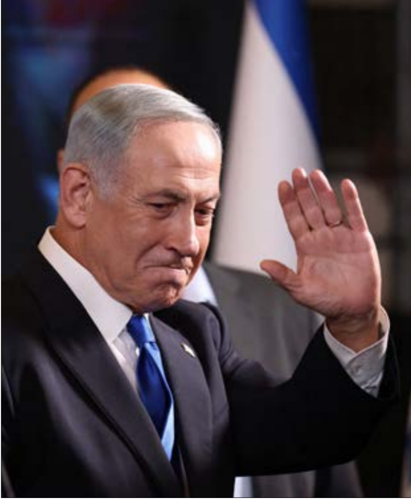
مهمة نتنياهو ستكون شاقّة وطويلة

يدفع الحزب الديمقراطي، في هذه الانتخابات، ثمن إصراره، أولاً، على تعزيز حظوظ بايدن ليكون دوناً عن سواه، وخشية تصعيد «التقدميين»، مرشّحه إلى الانتخابات الرئاسية. فمع تراجع شعبيّته التي لامست حدود الـ 42%، والتي قد تؤدّي دوراً حاسماً في خسارة الحزب الديمقراطي سيطرته على مجلسي الشيوخ والنواب، لا يبدو الرئيس الأمريكي منخرطاً في الشؤون «الشعبية»، بل مركزاً لجدل اهتمامه على قيادة الصراع مع روسيا، وما ستؤول إليه معركة الريادة والديموقراطية التي يضعها، في الحال هذه، في صلب أولوياته، في المقابل، فإن تراسب، المنافس الآخر في الانتخابات، يتوقّف عند ما يقادته في تاريخ الحركة الأسيرة. وأفادت المصادر بأن الاتصالات الفلسطينية ستتمشع خلال الأيام المقبلة، لتشمل جميع الفصائل والمسؤولين عن ملفّ الأسرى خارج السجون والمؤسسات