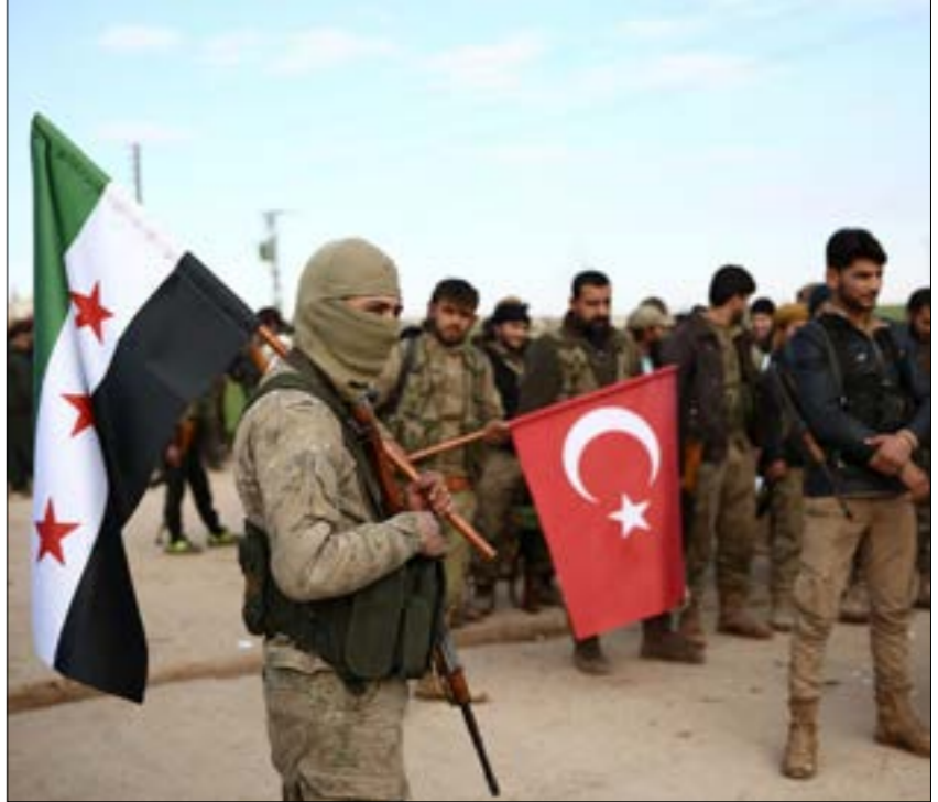
يرى مراقبون أتراك أن السلطة في بلادهم تمارس سياسات مزدوجة ومتناقضة

أشار الاجتماع الأخير في غازي عنتاب بين مسؤولين أمنيين أتراك وقادة «الجيش السوري الحر»، الكثير من الجدل في تركيا، حيث ذكرت صحيفة «تركييا» الموالية لحزب «العدالة والتنمية»، أن الاجتماع تناول بشكل رئيس مسألة مستقبل المعارضة العسكرية السورية وتنظيم عملها، وتقرّر في خلاله اتّخاذ الإجراءات المناسبة لتحويل «الجيش الحر» إلى جيش نظامي، وتشكيل مؤسسات شرطة واستخبارات تابعة له، فضلاً عن وضع خطوط واضحة للفصل بين الأجهزة العسكرية والأجهزة المدنية، بحيث تُنقى الأولى محصورة في مقرّاتها. وتُعتر هذه محاولة تركية متجنّدة لتوحيد الفصائل، بعد أكثر من محاولة فاشلة في السنوات الأخيرة، لكنها تبدو الأكثر جدية إثر توسّع «هيئة تحرير الشام»، وسيطرتها على مناطق كانت تابعة لـ «الجيش الوطني» التابعة الأخيرة