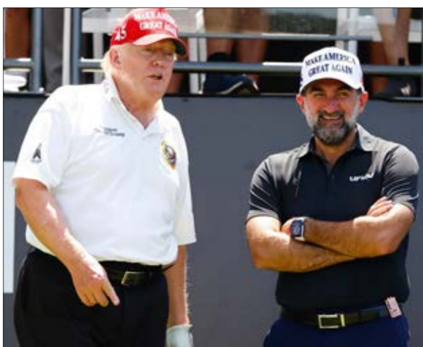
باين الريمات الى جانب ترامب معتمرا القبة التي تحمّل شعار حملة ترامب، اجعلوا امريكا عظيمة من جديد، (مت الوهب)

عام 2022، وهو أقلّ بنصف مليون برميل عن المعدل اليومي الذي سُجّل عام 2019. قد يكون بايدن، على رغم الانطباع المخوّن عنه بأن حركته بطيئة، واحداً من أكثر الرؤساء الأميركيين الذين عملوا داخلياً وخارجياً لكبح أسعار النفط، إذ أفرج عن كميات كبيرة من المخزون الاستراتيجي، بعدما فشلت جهوده في إقناع ابن سلمان بزيادة الإنتاج، على رغم تنازله له من خلال زيارته في الأخيرة، وسوّلاً إلى عتبة 93 دولاراً لصاحب غيره من الرؤساء من قبل في حال تحققت الضخارة المستويات إنتاجها لتعويض النقص، على رغم قدرتها المحدودة على التعويض. فالولايات المتحدة تتّجه، بحسب إدارة معلومات الطاقة الأميركية، إلى تحقيق معدل إنتاج يبلغ 11.8 مليون برميل يومياً في