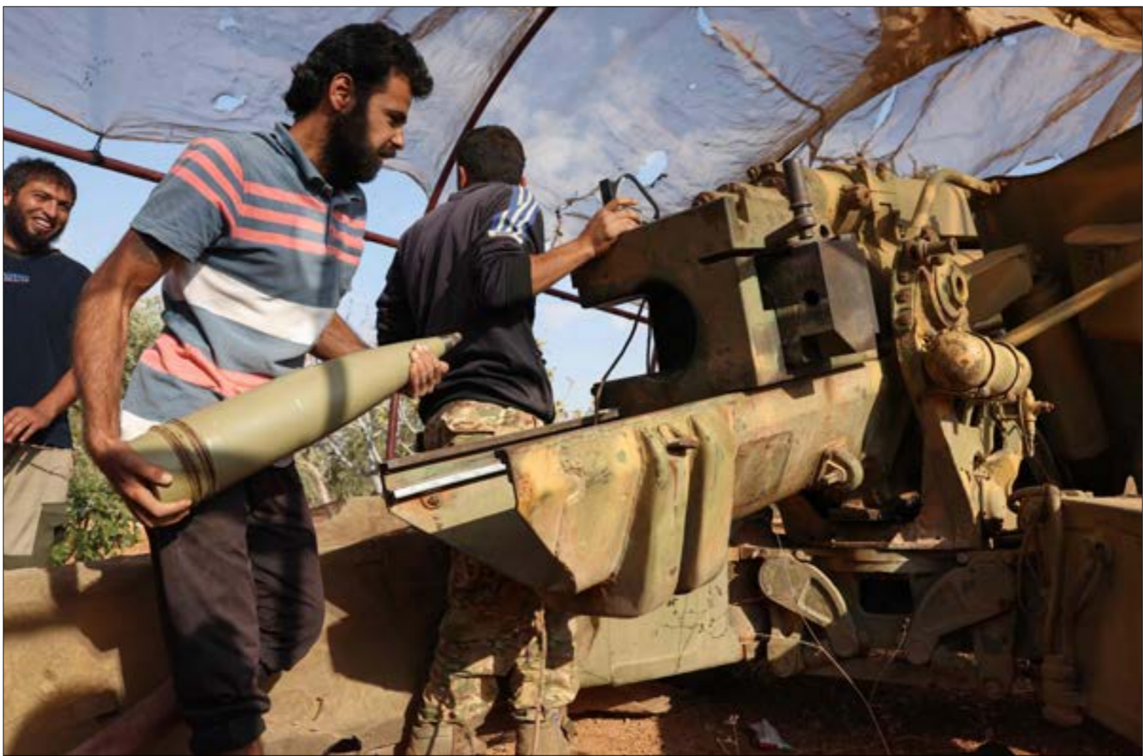
الاجتماع بين المسؤول الأمني التركي ومصالح ريف حلب كان حاملاً للخبرة

مسار الانفتاح على دمشق والتقارب معها. على أن هذا المسار، وعلى رغم استنطائه وتباطؤه وكثرة العقبات التي تعترضه، لا يبدو متجنّداً تماماً؛ إذ ثقت خطوات تركية - سورية متبادلة