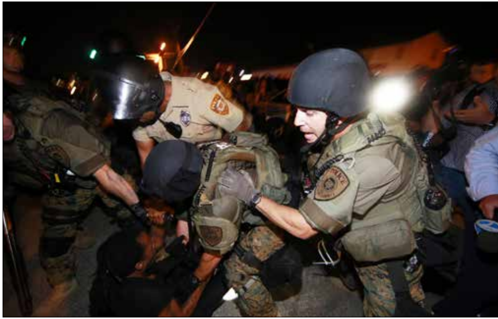
مالكوم لم يخلق غضب السود بخطاباته، بل نظمهم ووجهه

قبل كل شيء، كان مالكوم ليحتسّر على غياب التحرك المستهدف والمستديم. أجل، كثيرون يكملون العمل الشاق الذي انطلق بعد فيرغسون، ولكن كثيرين غيرهم قد نسوا ذلك. فاليوم، حين يتكلم الناس حول كيفية محاربة العنصرية يبدو «التهديد» فارغاً. لقد بتنا ضعفاء إلى حدّ عدم الاكتراث، وبيات الجميع يتلهم بسهولة عن التحرك المدني بسبب ثقافة «البوب» والاستهلاك التكنولوجي. فكيف لنا أن نتوقع التغيير فيما لا يشعر أي أحد بالمسؤولية لتأمين العدالة، بمن فيه هيئات المحلفين والمدعين العامين.