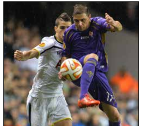
مهمات الليلة في ملاعب إيطاليا

يُحسم الليلة مصير الفرق المتأهلة إلى دور الـ 16 والمودعة لمسابقة «يوروبا ليغ» لكرة القدم من خلال 16 مباراة تدور في كافة أرجاء أوروبا ضمن إياب دور الـ 32. وإذا كانت مهمة نابولي الإيطالي وأفرتون الإنكليزي سهلة، فإن مهمة اشبيلية الإسبانية حامل اللقب وليفربول الإنكليزي تبدو مقلقة، بينما يواجه روما الإيطالي خطراً حقيقياً. وفاز نابولي خارج ملعبه على طرابزون التركي 4-0 وحذا حذوه إفرتون الفائز على يونغ بوز سويسري (1-4). أما اشبيلية،