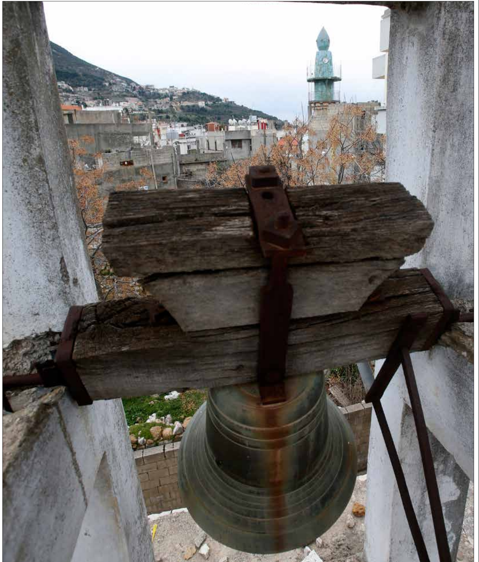
تستكين كنيسة البلدة في الحارة القديمة