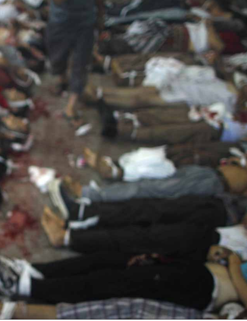
هناك تراجع كبير في القبول المجتمعي بـ«الجماعة»