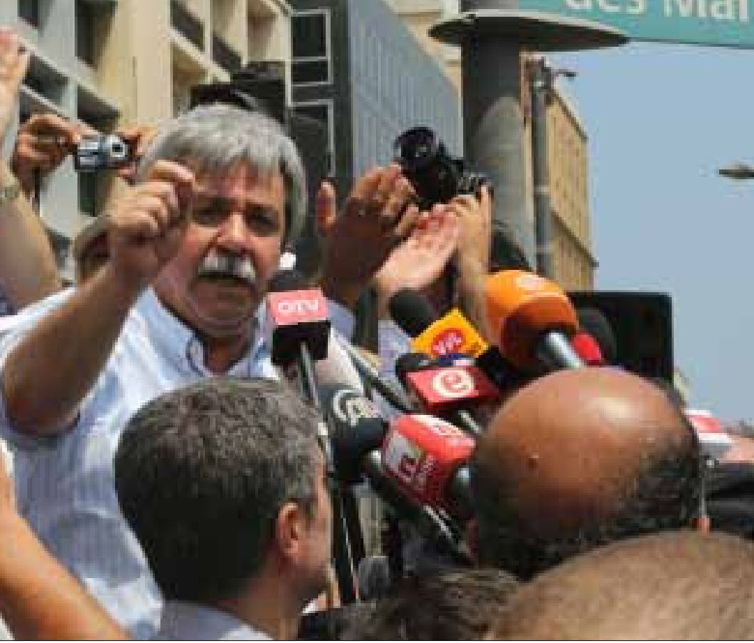
غريب أعلن عن اتجاه إعلان اتحاد عام للنقابات في الدولة (مروان طحطح)

هيئة التنسيق، تصر على إقرار السلسلة كحل وحيد