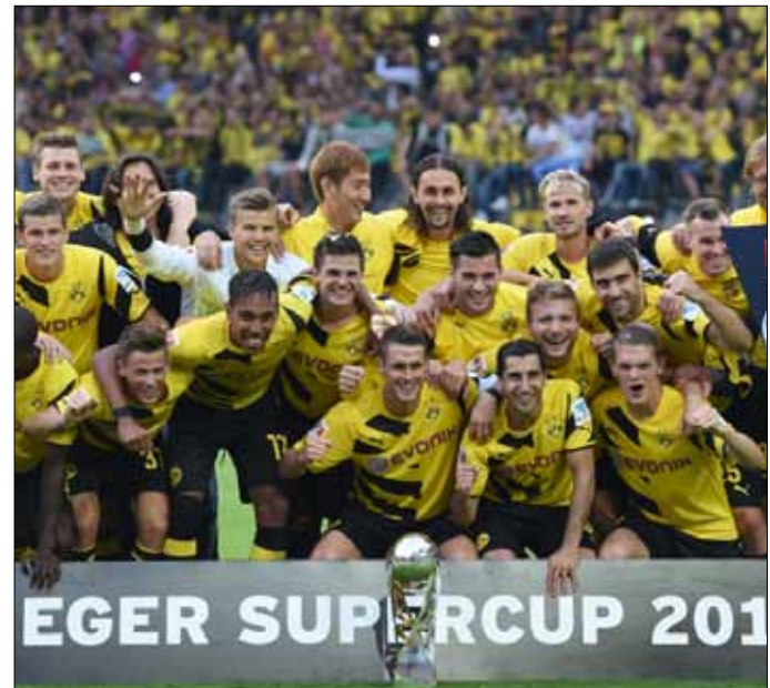
لاعبو دورتموند بعد تتويجهم بالكأس السوبر

دفع بايرن ميونيخ ضريبة تألق نجومه في كأس العالم، فخسر الكأس السوبر الألمانية أمام غريمه بوروسيا دورتموند الذي حسم اللقاء على ملعبه «سيغنال إيدونا بارك» بنتيجة 2-0.