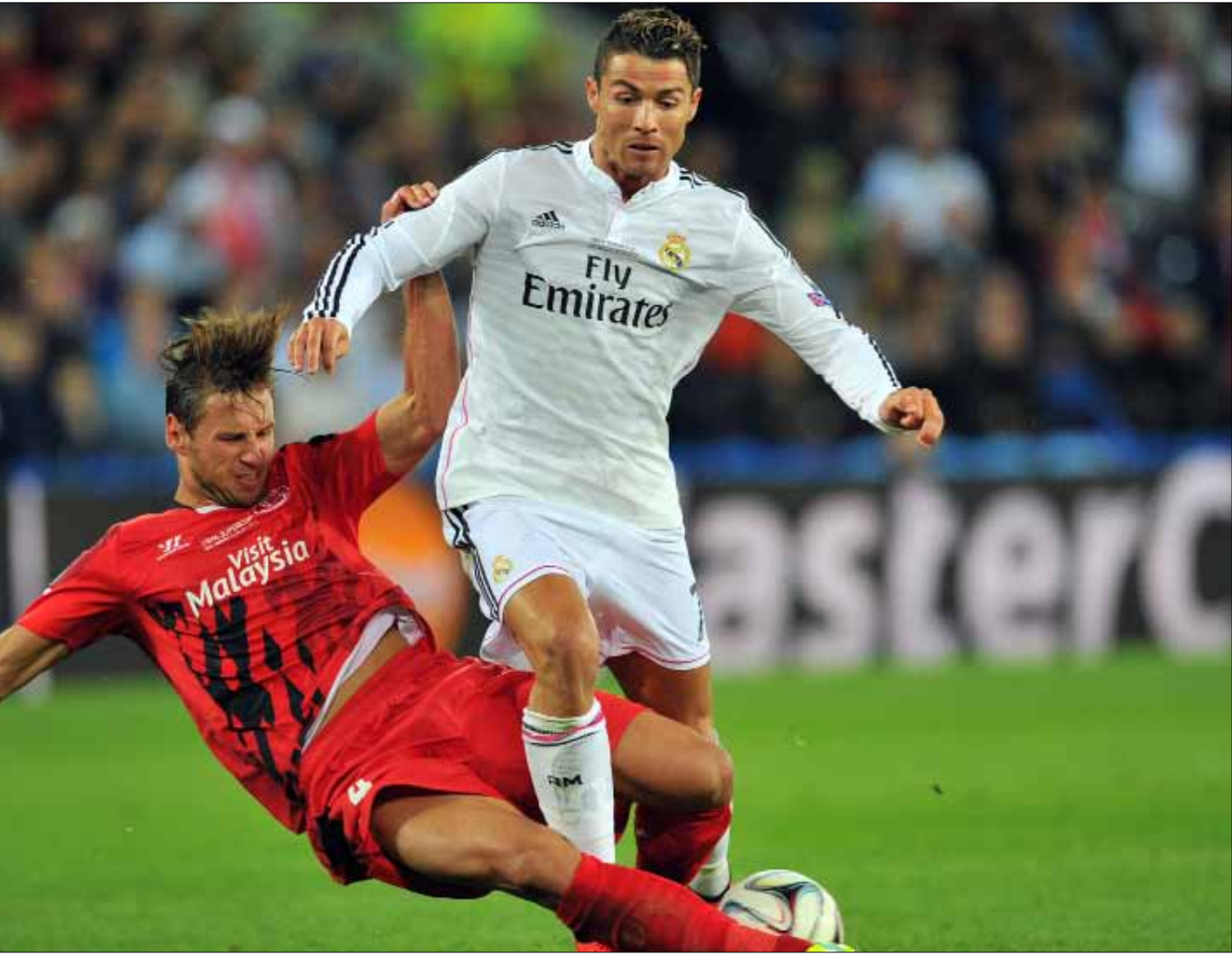
لم تشف ركبة رونالدو نهائياً

قال مهاجم ريال مدريد الفرنسي كريم بنزيمًا، إنه يتفهم احتمالية ضم ناديهم لمهاجم آخر قبل انتهاء الانتقالات الصيفية، مبرراً تحسين الفريق في الفترة الحالية. وقال بنزيمًا: «بالنسبة إلي، إن ريال مدريد هو أفضل نادٍ في العالم، ومن الطبيعي أن يسعى إلى ضم مهاجمين».