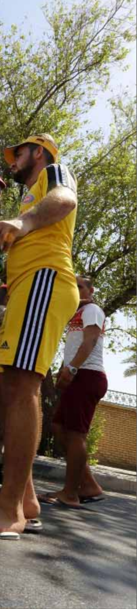
تخلي 21 نائبا إضافيا عن المالكي