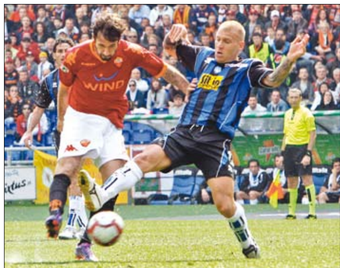
المونتينغري ميركو فوتشينيشت مفتتحا التسجيل لروما امام أتلانتا (أ. تارانينو - أ ب)