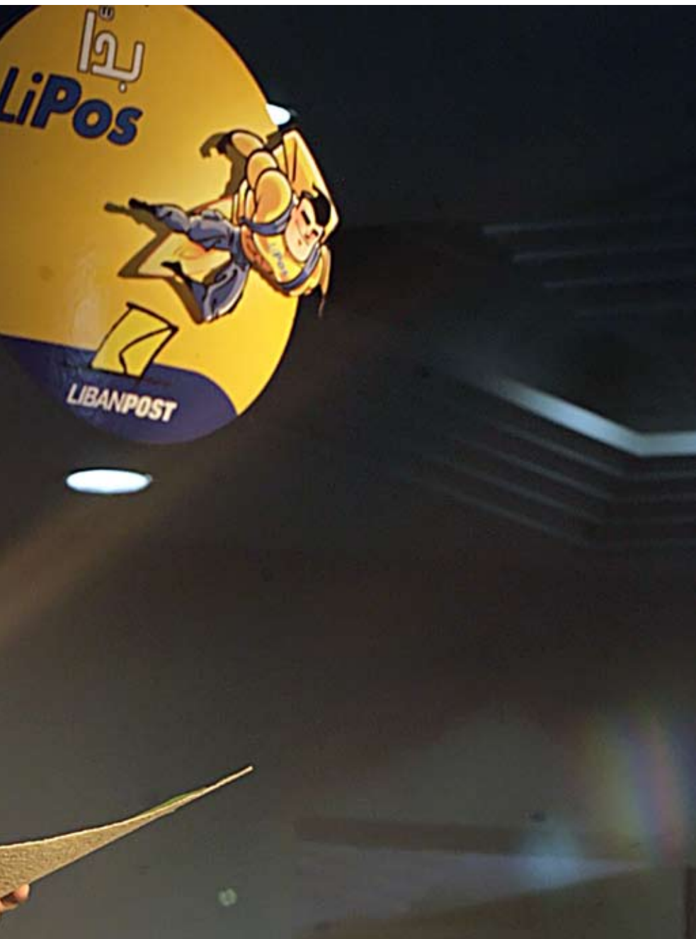
خصّص البريد علناً، بسرعة كبيرة، وخارج كل المقاييس السليمة

تمثّل سياسات الخصخصة جزءاً عضوياً من مبادئ الليبرالية الجديدة التي سادت النظام الرأسمالي منذ أوائل الثمانينيات من القرن الماضي. وتحوّلت الليبرالية إلى أيديولوجيا جامدة بعد تبني مراكز النظام الرأسمالي لها، وفرضها على المنظمات المالية والاقتصادية العالمية. وقد مكّنها ذلك من ممارسة قمع فكري للأفكار الاقتصادية المغايرة، وتشويه الواقع المعيش لبعض الأنظمة الاقتصادية، والتاريخ الاقتصادي للعديد من التجارب التنموية في العالم. فماذا عن لبنان؟