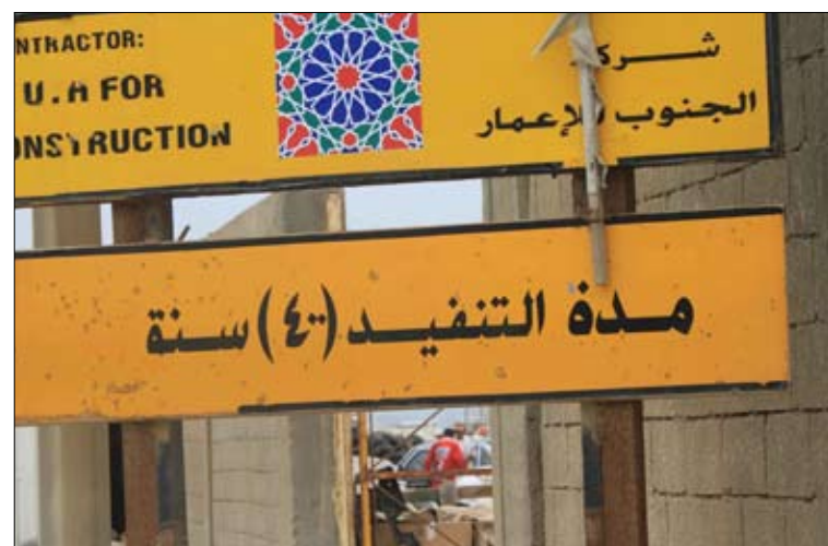
يتضخم المكب ويزداد طولاً وعرضاً يوماً بعد يوم

هل ينتظر الصيداويون مئات السنوات الإضافية كي يتخلصوا من مشكلة مكب النفايات أو «جبل الزباله»، كما يسمونه؟ هل تعدلت مدة المشروع المقرر تنفيذه خلال أربع سنوات إلى أربعين سنة؟ على الأقل، هذا ما يقره المازون في المكان على اللافتة الحديدية الصفراء الموضوعية عند مدخل مكب النفايات في المدينة. فقد لفت انتباه هؤلاء ما كتب على اللوحة الأخيرة من اللافتة الرسمية «مدة التنفيذ 400 سنة»، بعدما كانت 4 سنوات. وكانت اللافتة قد وضعت منذ عام 2004 حين حضر الأمير الوليد بن طلال شخصياً لرعاية حفل توقيع الاتفاقية بين مؤسسته الإنسانية وبلدية صيدا لتنفيذ مشروع «معالجة مكب