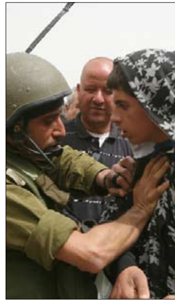
فلسطيني يواجه جندي إسرائيلي خلال تظاهرة في بيت جالا أمس

ولفتت «هارتس» إلى أن مضمون الأمر غير واضح وعمام، ويتبين منه أن تعريف «المتسلل» يشمل الفلسطينيين من القدس الشرقية، وبينهم مواطنو دول تقم إسرائيل معها علاقات دبلوماسية مثل الولايات المتحدة، وحتى مواطنين إسرائيليين «فلسطينيين أو يهوداً»، وذلك بحسب قرارات ضباط الجيش الإسرائيلي. ولفتت «هارتس» إلى أنه خلافاً لقوانين الكنيست، فإن إعداد الأوامر العسكرية بحري في الغرف المغلقة التابعة للمنظومة العسكرية، وحتى لدى نشرها تخفى تفاصيل كثيرة منها من دون لفت الأنظار إليها. وكان مركز «الدفاع عن الفرد» المنظمة الأولى التي انتبعت إلى خطورة الأمر