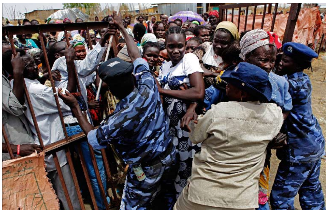
تدافع للدخول إلى مركز الاقتراع في بلدة ملكال في جنوب السودان

وفي الخرطوم، انتظر الناخبون في صفوف طويلة لأكثر من ساعة ليشاركوا في عملية التصويت المعقدة، لاختيار رئيس الجمهورية وأعضاء المجلس الوطني والوالي وأعضاء مجلس الولاية. واصطف الرجال في طوابير منفصلة عن النساء، وطلب من الناخبين غمس إصبع في حبر أخضر اللون لا يمكن إزالته بسهولة قبل الإدلاء بأصواتهم. واستغرق الرئيس السوداني، عمر البشير، عشر دقائق للإدلاء بصوته، وكان الالاف في معظم المراكز أن صفوف النساء أطول من الرجال، وأن معظم الناخبين من الشباب دون 30 عاماً. وفي الجنوب، تعين على رئيس حكومة جنوب السودان، سلفاً كبير ميارديت، الانتظار عشرين دقيقة تحت شجرة حتى