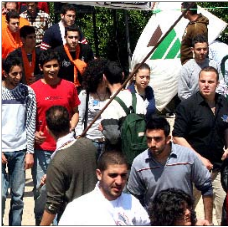
يرى كتائبون أن الكلام عن الديموقراطية الحزبية أمس كان خطأ كبيراً

وهو إذاً تحدث، وفق أحد الكتائبيين، باعتباره ابن رئيس الحزب أمين الجميل وحفيد مؤسس الحزب بيار الجميل، الذي انسحب حفيده الآخر، النائب نديم الجميل، أمس من الاجتماع ومعه خمسة من أعضاء المكتب السياسي، قبل إلقاء سامي كلمته، ما يُفسر كإشارة إلى أن نديم يسمع الكلمة السياسية التي يلقيها رئيس الحزب ويترك النقاش في القضايا الإدارية للخولة. ويرى أحد الحزبيين أن سامي خالف علانية في لقاء الأمم المادتين 34، و40 من النظام العام اللتين تنصان على أن «المكتب