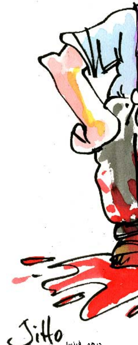
جيهو - فرنسا

وقعت مرسوماً يتضمن مجموعة من التعديلات والإضافات على قانون العمل، ومن بينها قانون يحمي العمال من الإصابات المهنية، وسأعرض المرسوم على مجلس الوزراء في الأسابيع القليلة المقبلة تمهيداً لإقراره وسأسعى لأن يكون بنداً أول في جدول الأعمال». يخلق المرسوم الجديد العدالة والتوازن على مستوى حقوق العمال الناتجة من إصابات العمل، ويتوقع حرب ألا يلقى القانون أي تحفظات ويُقر في أسرع وقت ممكن. بالنسبة إلى الشق المتعلق بطوارئ العمل والأمراض المهنية في إطار قانون الضمان، الذي لم يدخل حيز التنفيذ، يرى الوزير حرب «أنه ليس صالحاً كفاية لضمانة حقوق العمال من الإصابات المهنية، لأن النصوص القانونية لم تكن كافية، وبحاجة إلى كثير من التعديلات