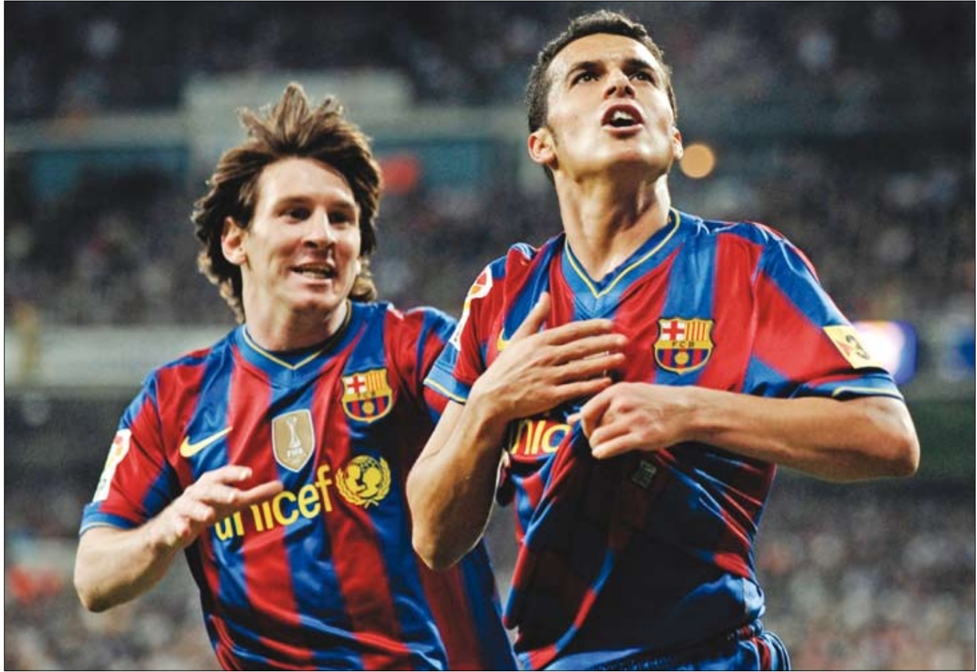
مسجلاً هدفي برشلونة في مرمى ريال مدريد بدر و ليوينيل ميسي يحتفلان بهدف الأول

أوقف برشلونة سلسلة من 12 انتصاراً متتالياً لريال مدريد وجدّد فوزه عليه لينفرد بصدارة الدوري الإسباني لكرة القدم. وفشل مانشستر يونايتد في استعادة المركز الأول في انكلترا، بينما تبدّل الوضع في إيطاليا بارتقاء روما الى الصدارة بدلاً من إنتر ميلانو المتعثر، وعزز بايرن ميونخ مركزه الأول في ألمانيا رغم سقوطه في فخ التعادل