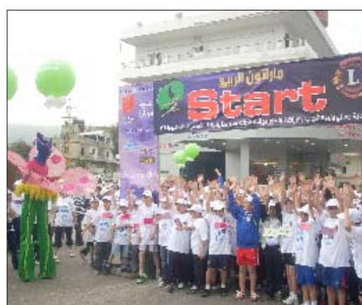
من انطلاق السباق

احتضنت شوارع زغرنا الزاوية آلاف المشاركين في ماراتون الربيع، برعاية وزير الشباب والرياضة الدكتور علي حسين العبدالله