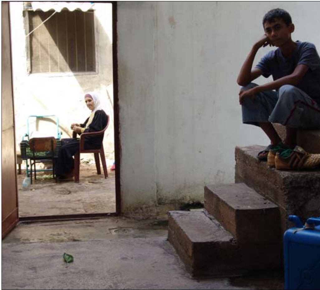
الانتظار... في مخيم مار الياس (هشام غزلان)

قام بالاستطلاع عن الأونروا، الذي نظّمته ثلاث جمعيات فلسطينية، 150 متطوعاً في سوريا ولبنان، قسّموا إلى ثلاث مجموعات: رؤساء المجموعات، الباحثين والمراجعين، والمرمزين. أما تقدير حجم العينة المستطلعة بـ 1460 فقد حددت وفقاً لإحصاءات الأونروا عام 2009، إذ بلغ عدد اللاجئين 421.993 في لبنان، و467.417 في سوريا. وقد جاءت نتيجة الاستطلاع على النحو الآتي: 92% يؤيدون استمرار الوكالة في عملها، 69,7% غير راضين عن أدائها، 86% يرون الخدمات غير كافية، 55,5% يرون أن خدمات الإغاثة ضعيفة، 35,5% يرون أن خدمات التعليم كافية، و44,9% يرون أن الخدمات الصحية ضعيفة