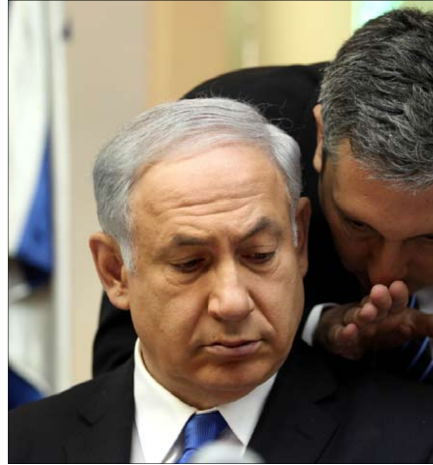
ننياهو يستمع لأحد مستشاريه خلال اجتماع الحكومة الأخير

لعل الإجراءات التي اتخذتها حكومة ليتوانيا، والتي أجمع البعض على أهدافها لضبط نمو الدين، غير شعبية، ولاقت معارضة نظراً إلى الإنكماش الاقتصادي الذي سببته والتصديق على العاملين والمتقاعدين. لكن هذه الإجراءات التي جرت دون تدخل من صندوق النقد الدولي، كما العادة، جعلت ليتوانيا مثالا للدولة المسؤولة التي تأخذ مصيرها بيدها، بدلاً من الهرب إلى الأمام عبر بعض الشعارات، مثل «ليس المهم حجم الدين»، «بل المهم تكبير حجم الاقتصاد»