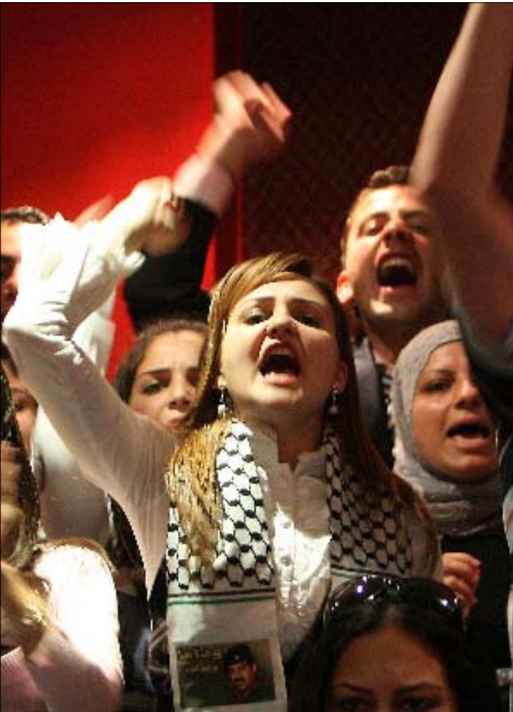
أحيا حزب البعث العراقي في لبنان، أمس، ذكرى اعدام الرئيس صدام حسين

على صعيد آخر، لا يزال موعد زيارة الرئيس سعد الحريري إلى سوريا يحتل واجهة الحياة السياسية. وتؤكد المعلومات المتوافرة أنه لم يحدد موعد رسمي للزيارة في الفترة الماضية، وأن كل ما جرى هو نقاش بشأن مشروع موعد بين 13 نيسان و14 منه، جرى القفز عنه في ما بعد انطلاقاً من ارتباطات رئيس الحكومة السورية محمد ناجي العطري، الذي بدأ زيارة رسمية للجزائر أمس تستمر يومين، فضلاً عن أن الجانب اللبناني لم يكن قد أنهى ما عليه من تحضيرات لتوفير زيارة ناجحة، إذ يصير الجانب السوري على أن تكون ذات طابع عملي لا بروتوكولي.