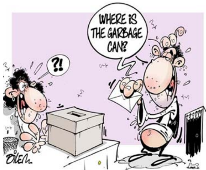
ناخب جزائري يسأل: «أين سلة القمامة؟» (من أعمال علي ديلم)

الكاريكاتورية التي تحتل اليوم مكانة مهمة في الصحافة الجزائرية. إذ لا نكاد نجد يومية أو أسبوعية (يتجاوز عددها الإجمالي الـ 53 مطبوعة) لا تعرض رسماً كاريكاتورياً فوق صفحاتها.